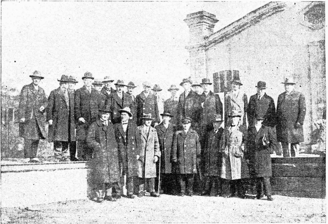
Balti riikide riigi- ja omavalitsusteenijate II. konverents Tallinnas, 24.–25. IX. 1927. a. Välisdelegaatide vastuvõtmine Balti jaamas.

5) Riigi- ja omavalitsusteenijate kutseorganisatsioonid peavad pöörama kõige tõsisemat tähelepanu oma majandusliku seisu-