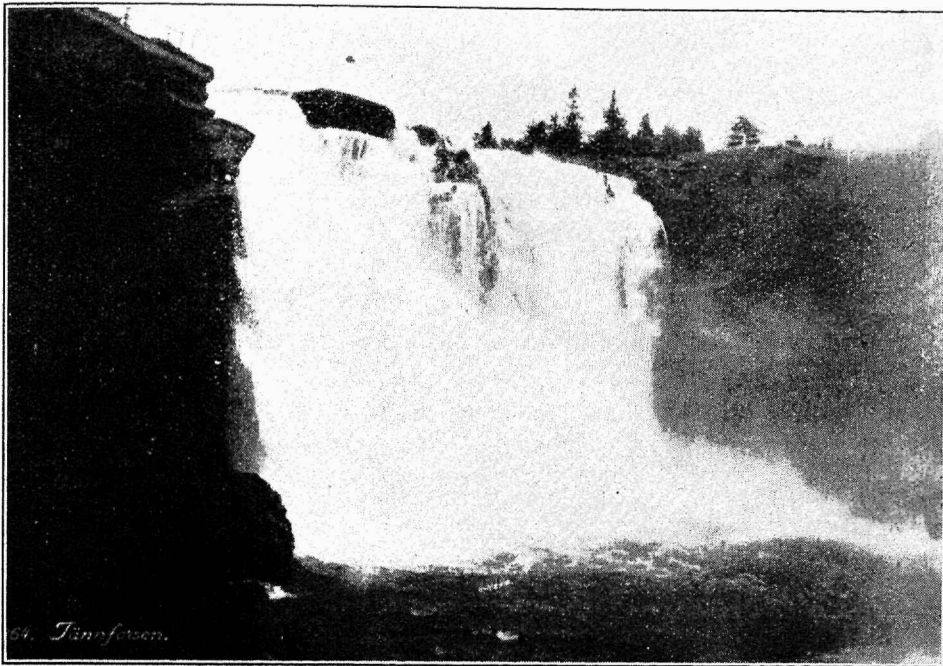
Tännforseni kosk (umbes 20 kilomeetrit Are jaamast Norra piiri poole).

ja meie sõit kujunes tõelikuks naudinguks. Vähesed lahkused enne keskööd tekilt, kuigi all oli magamise ruum muretsetud. Järgmise päeva hommikul oldi juba varakult väljas, sest et peagi ilmusid silmapiirile skäärid ja nende ilu taheti juba eemalt nautida. Ilm oli veel toredam kui eelmisel päeval. Keskpäevaks olime täiesti skääride valdkonnas. On neid siin aga palju ja kui toredad! Kolmetunnilise sõidu järele imeilusate panoraamide keskel jõudsimise Stokholmi. Pühapäeva ja ilusa ilma tõttu haigutas meile sadamas tühjus vastu. Meid ei olnud sadamas keegi vastu võtmas peale tolli- ja politseiametnike.