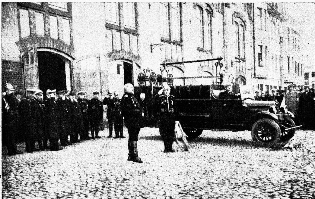
T. V. T. Veemuretsejate auto ristimine 1. mail 1930 a.

Hiljem tekkis liigete keskel mõte asja lõpule viimiseks koguda rühmkond jaoskonna liikmeid, kes vabatahtlikult jõukohaselt kohustuvad maksma aasta jooksul igakuulise toetussumma. Ka see mõte leidis liigete keskel ühemeelset poolehoidu ja peaaegu kui üksmees olid jaoskonna liikmed oma abiannda käega aitamas, kes kohustus andma kuus 1 kroon, kes kaks ja ka viis ja rohkem krooni. See liigete enese ohverdamine ja ka väljaspoolt jaoskonda üksikute isikute ja organi-