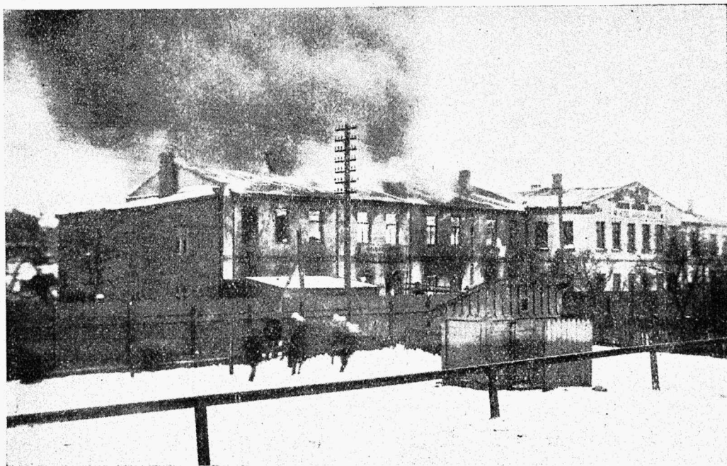
Tartu värnitsa vabrik põlemas.

ei suuda üksinda tulest jagu saada, sellepärast anti üldine häire. Vabatahtlikud ruttasid viibimata appi, esimestena olid kohal ronijad omal autol.