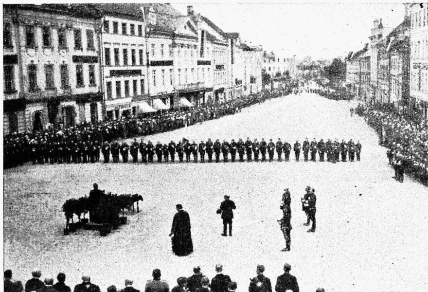
Tartu tuletõrje pidulik aktus raekoja platsil.

Järgmisel päeval, hommikul, pandi pärg surnuaial tuletõrjujate ühishauale, mis väga liigutav oli. Ühing mälestab ja austab oma tähtsatel päevadel ka