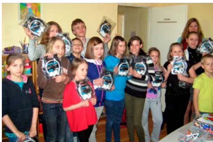
Naabrid Peeteli päevakeskusest kinkisid igale lapsele Tähetorni sünnipäeva puhul kõrvaklapid.