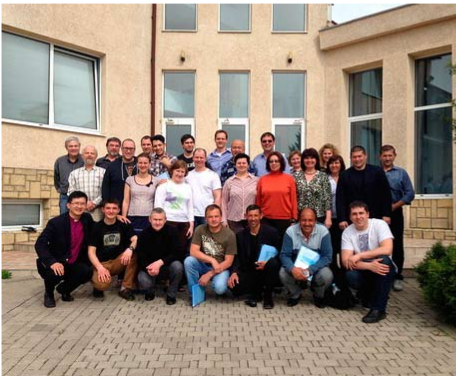
ÜMK Ukrainas (loe lk 7).