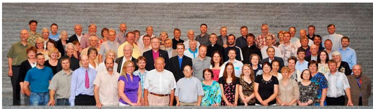
Meenus 2013. aasta aastakonverentsilt.