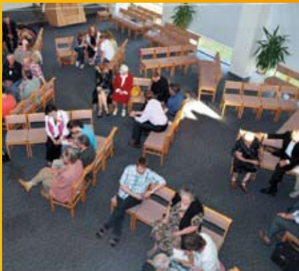
Arutelud Aastakonverentsil Pärnus. Loe lk 8

Esikaanel: EMK Tallinna koguduse segakoor Tartus vaimulikul laulupeol.