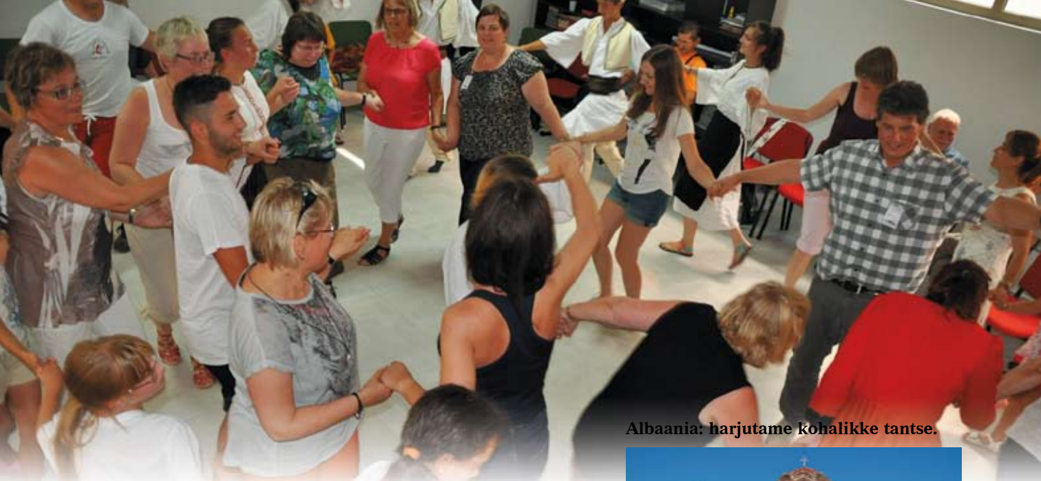
Albaania: harjutame kohalikke tantse.