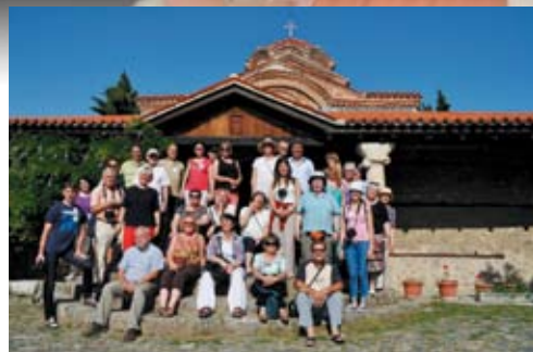
Grupipilt, tehtud ühe kiriku juures 365-st.

Loomulikult oli võimalik tutvuda ka Ohridi piirkonna kaunimate paikade ja nende ajalooaga. Näiteks saime teada, et seal on 365 kirikut ehk siis soovijal on võimalik aasta jooksul külastada iga päev erinevat pühakoda. Ühel konverentsi päeval olime oodatud külla Albaanias Pogradecis asuvasse metodisti kirikusse. Konverentsil osalejaid võeti vastu sooja külalislahkusega ja tutvustati teenimistööd oma koguduses ja linnas. Pogradeci kogudusel on kirikuhoone rannapromenaadil, kuid kuuldavasti vajavad nad juba peatselt uusi ja veel suuremaid ruume. Rõõmuga näidati meile puuetega inimeste päevakeskust linnas ja töökoda, kus koguduse naised valmistavad riidest kotte, mida siis kogudusele tulu toomiseks müüakse. Päeva lõpuks tutvustati külalistele kohalikke rahvatantse, mida tuli meil loomulikult ka endal praktiseerida.