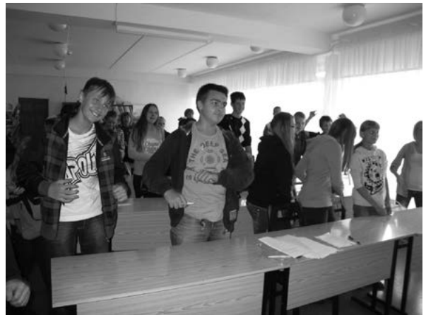
Projekti töötod koolides

Projektiinfo ja õppematerjalide koondamiseks on Sillamäe Lastekaitse Ühingu kodulehe juurde loodud sellele projektile eraldi alaleht aadressile www.sustainable.sscw.ee .