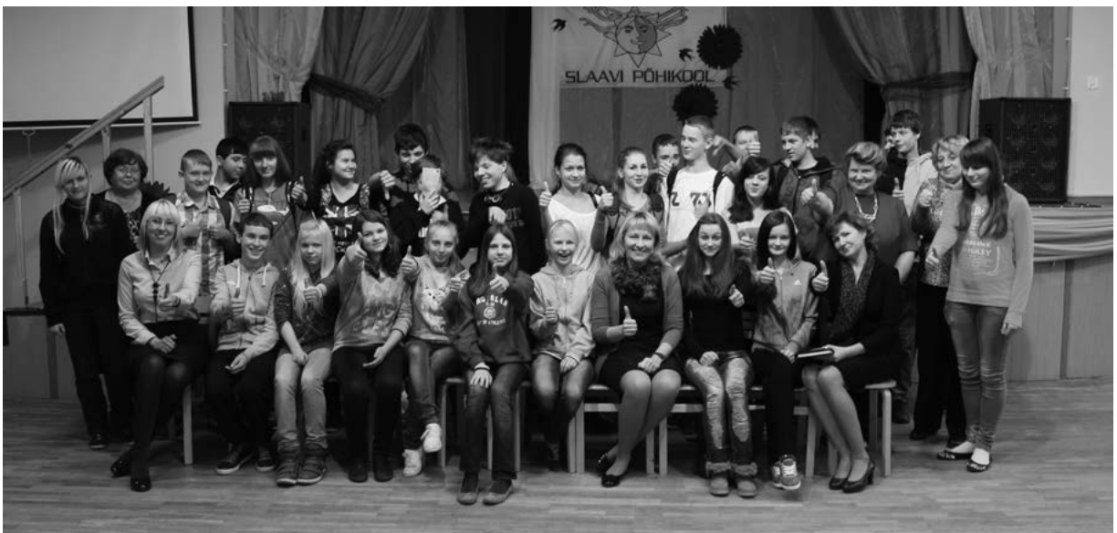
Töötuba Slaavi põikoolis