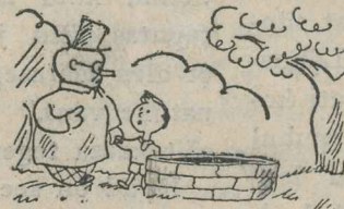
1. „Oi, üks vana ilus kaev!“