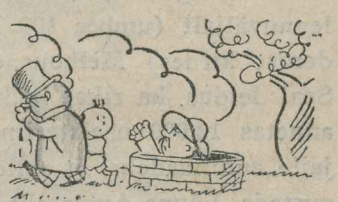
4. „Katsu sa mul teinekord veel kive pähe loopida!“

Virumaal, Püssi vallas, kas- vasid E. V-l. keskmises aia- maas kaalikad kuni 4 kg ras- kuseks. Aga soe sügis rikkus ka sissetehtud aedvilja taga- varasid. Nii näiteks pidi Ran- nu asunduses aednik hävitama