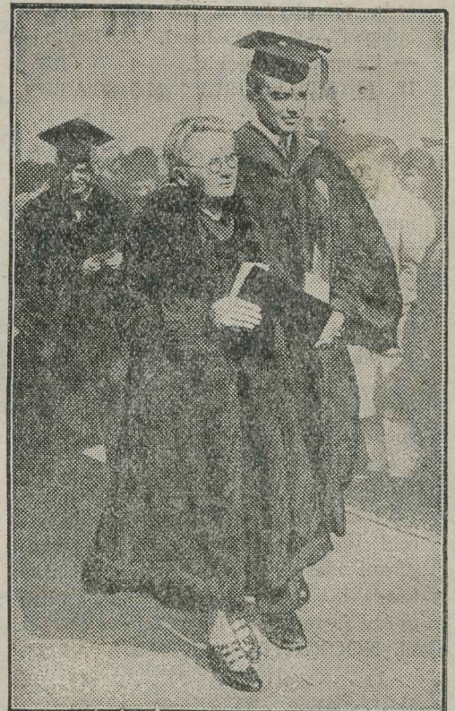
MARIE CURIE — tema pidulikul pro-moveerimisel St. Lawrence'i audokto-riks.