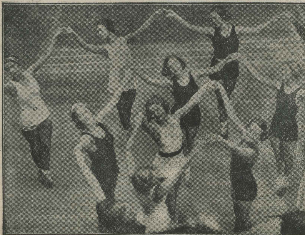
Õpilased hommikusel võimlemisel.

Moskvas on üle 2 milj. ela- niku ja 200.000 kodulooma: hobuseid, lehmi, koeri, kasse, kodujäneseid. Ka loomad hai- gestuvad ja vajavad arstiabi. Nendele „moskvalastele“ avati hiljuti eriapteek. Sealt võib osta ravimeid kassile, koerale, või teisele loomale. Ja kui loomaga juhtub õnnetus täna- val, võib kohe kutsuda tele- foni teel esmaabi auto, nagu seda tehakse kõigis suuremais linnades õnnetuste puhul ini- mestega.