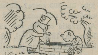
2. „Katsume õige, kui sü- gav ta on.“