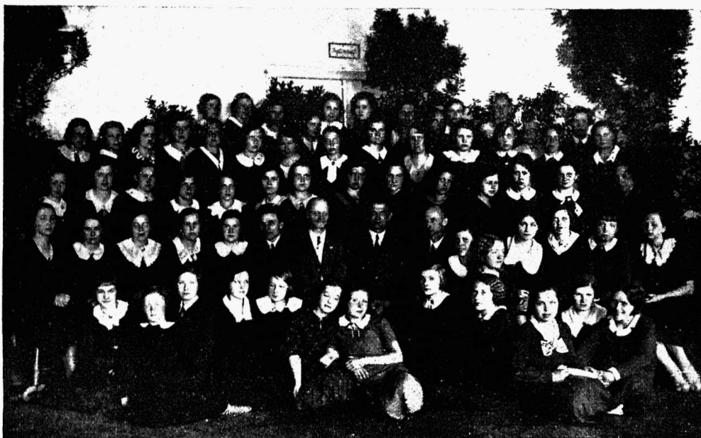
T. T. G. 1933./1934. õ/a. abiturientid ühes direktori ja klassijuhatajatega.

Kuid siis tuli hetk, mil elu pööras teise lehekülje. Isa, sa surid. — Sellest päevast alates jäi ema nii isesuguselt nukraks. Isa ateljeed, kes oli olnud kunstnik kunsti enese pä-