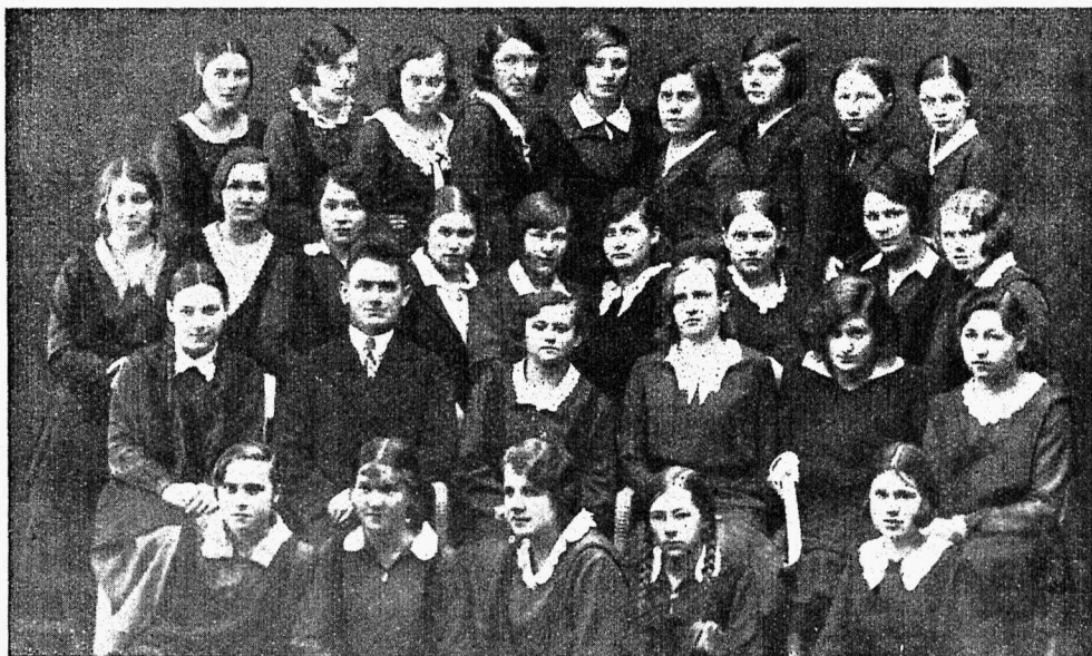
T. T. G. Õpilaspere esindus.

„T. T. G.“, olles kolmandat aastat Õpilaspere ürituste vastukajastajaks, Õpilaspere ürituste elustajaks ja mõnikord algatajaks, Õpilaspere avalikuks sõnaks must-valge peal, leiab oma ülesande olevat meeldivaks seesmiseks kohustuseks, millele andub kõigi oma vaimsete võimetega ja parimate tahetega. „T. T. G.“ ras-