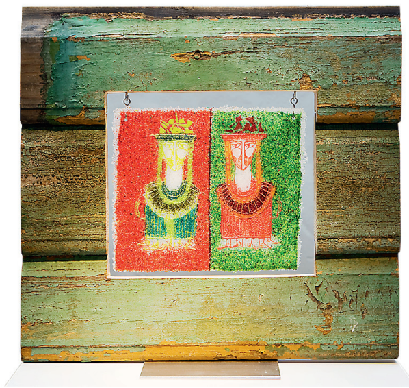
Kai Kiudsoo-Värvi tööd "Soldatid II, kodusõda" (2011) võiks nimetada kõige maalilisemaks teoseks sel näitusel.