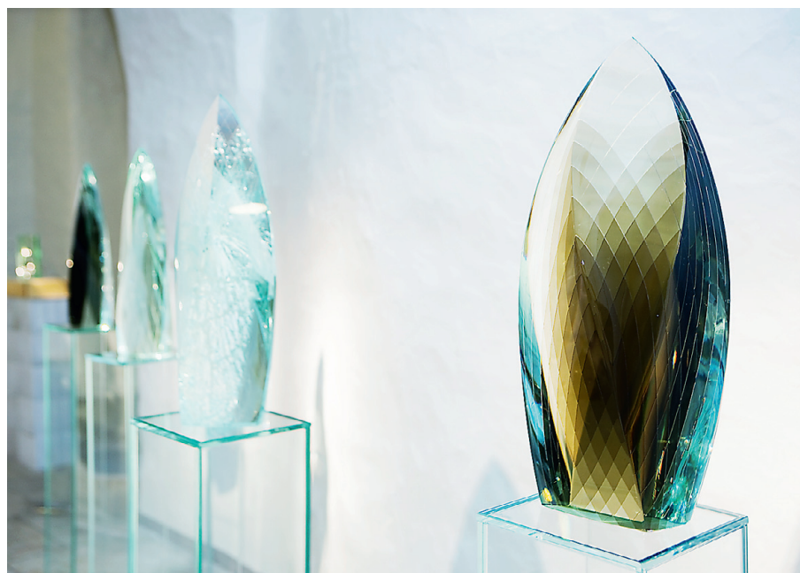
Ivo Lille teos "Värv 1-4" valmis vahetult enne näituse ülespanekut. Lill esineb tuntuks headuses, olles tehnika poolest klass omaette.