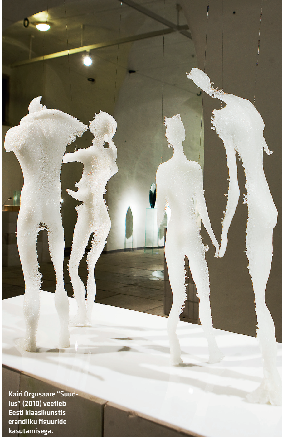
Kairi Orgusaare "Suudlus" (2010) veetleb Eesti klaasikunstis erandliku figuuride kasutamisega.