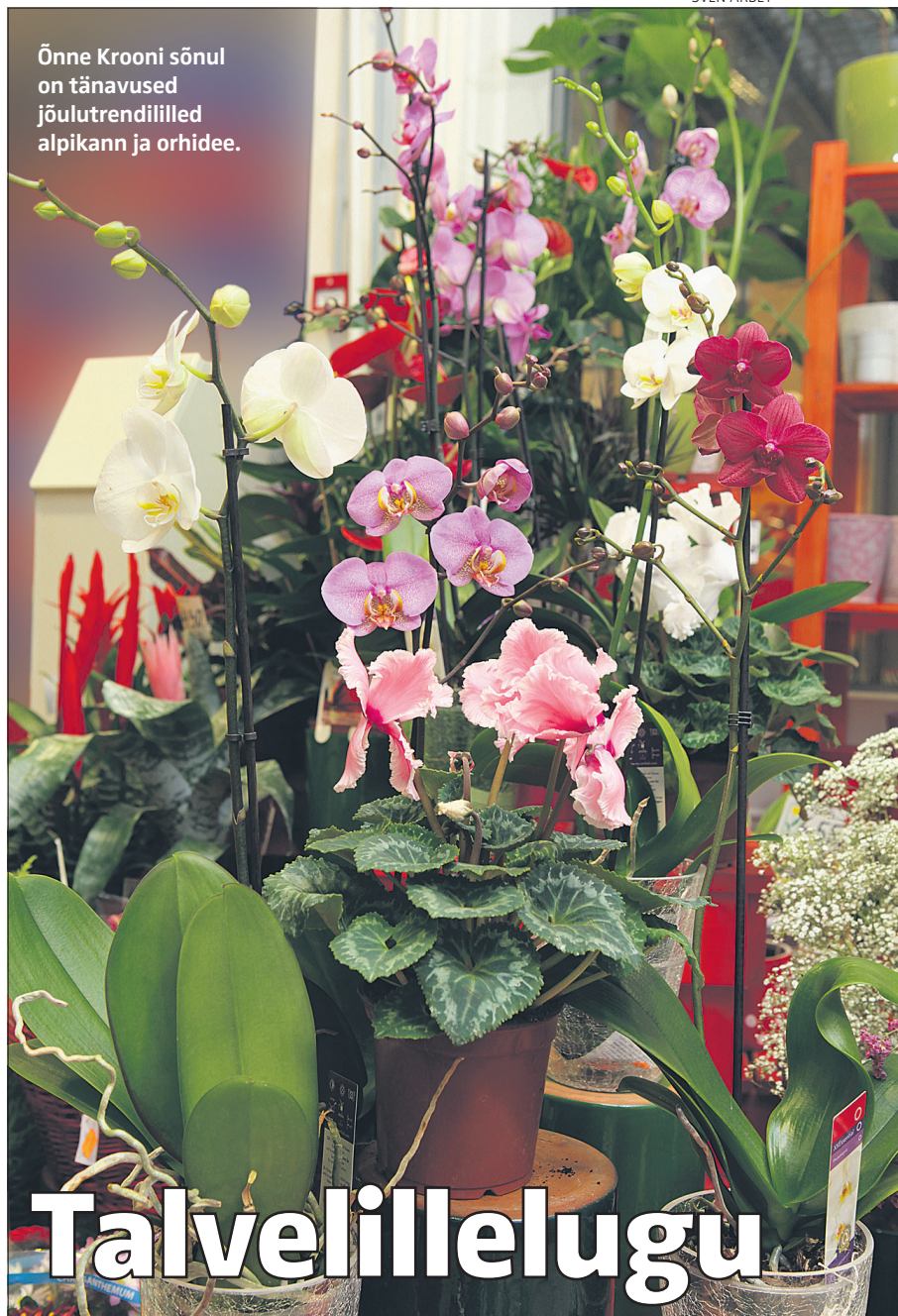
Õnne Krooni sõnul on tänavused jõulutrendililled alpikann ja orhidee.