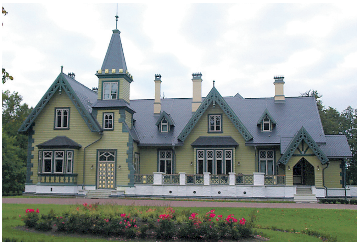
KÕLTSU mõis, ehitaja Eksklusiiv-ehitus OÜ, arhitekt Jüri Irik (AB Ehala ja Irik). Materjal: kiltkivi (Rathscheck).