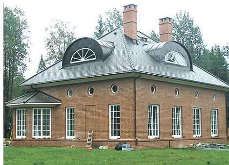
VILLA Harjumaal, ehitaja Eksklusiiv-ehitus OÜ, arhitekt Kert Kits. Materjal: piibrisaba katusekivi (Rothenburg).