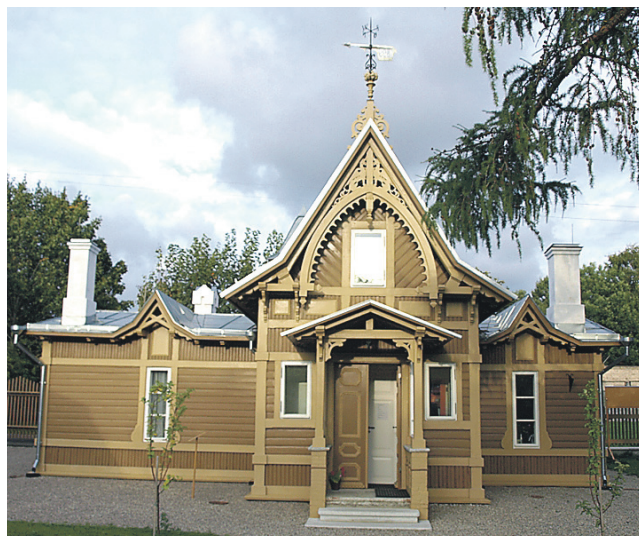
ADAMSONI muuseum, ehitaja Ehituskatus OÜ, arhitekt Allan Strus (AB Allan Strus). Materjal: 0,6 mm plekk (SSAB).