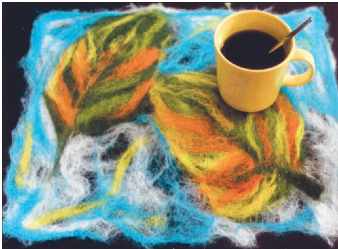
Villaheidest linik kohvilauale.

Raamatud on saadaval kõigis hästi varustatud raamatukauplustes üle Eesti. Tellimine telefonil 680 4444 või e-postil klienditugi@lehed.ee .