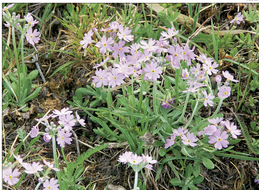
Põhja-Eesti jaanilill ehk pääsusilm.