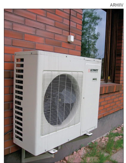
Soojuspumba aktiivaurusti. Tuleb arvestada, et selle ventilaator teeb ka häält.

Vahel arvatakse, et soojuspump on kõikvõimas kütteseade, mis kingib meile sooja toa iga ilmaga ja tagatipuks