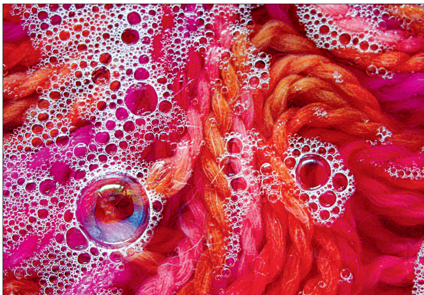
Loputage, kuni vesi jääb puhtaks.