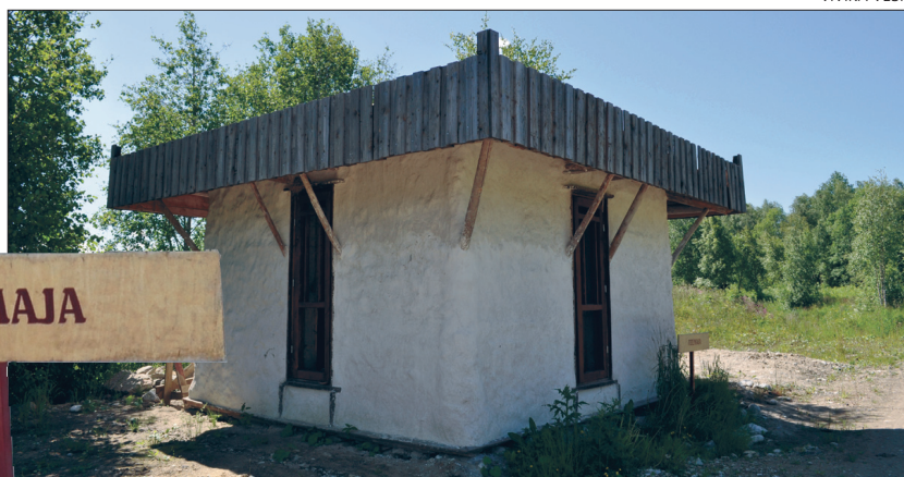
Lilleoru keskuse teemaja.

Neli aastat tagasi, kui Targu Talita Lilleorus esimest korda külas käis, oli hoonest püsti vaid midagi karkasitaolist. Ja keegi ei teadnud veel täpselt, mis sellest tuleb. Ühes seinas oli ehitust alustatud õige kummalisel vii-