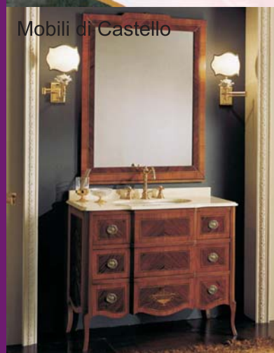
Mobili di Castello