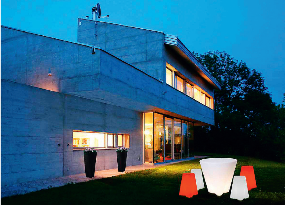
Linea Light Flower – valgustusega aiämööbel.

Pimeda aja saabudes muutuvad taas oluliseks välisvalgustid – kas siis sissesõidutee markeerimiseks või aia efektseks väljavalgustamiseks.