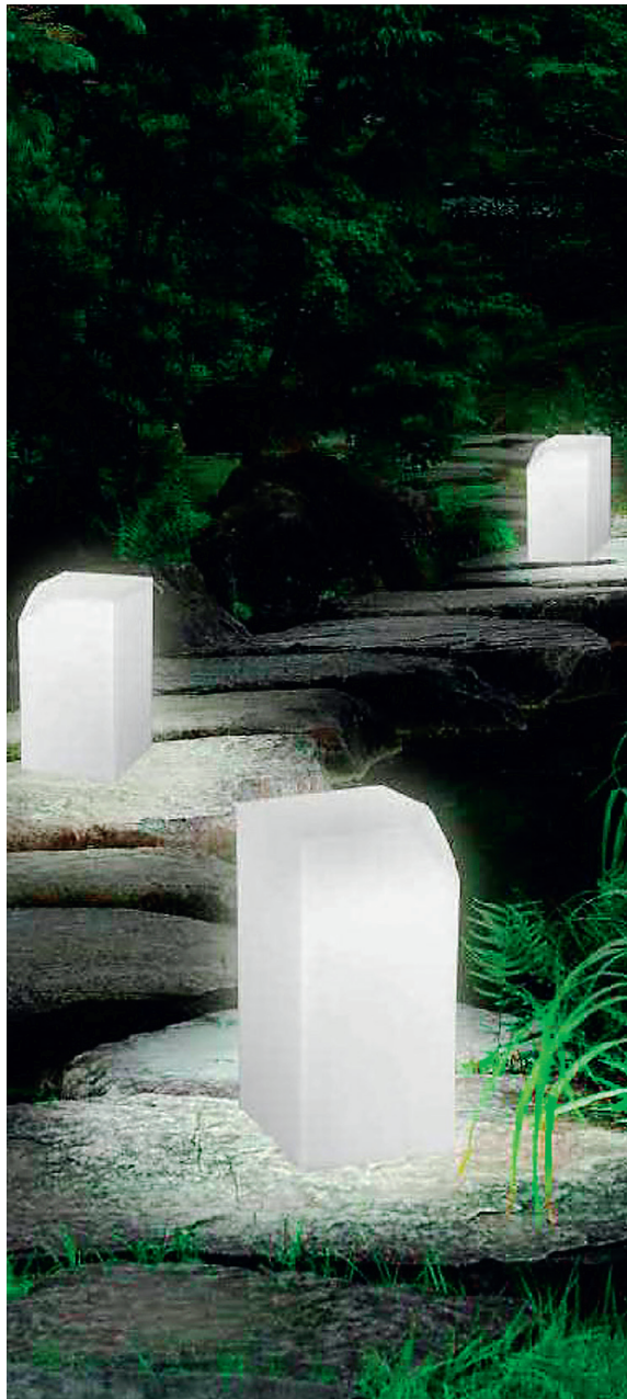
Tekst Villy Paimets

Ülalt: Studio Design Puraluce – paljude paigaldusvõimalustega valgusti. Wever&Ducre J.M – hobuserauakujuline valgusti. Flos SuperArchimoon – põrandalamp õue.