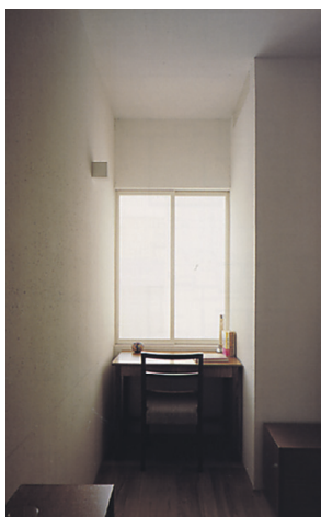
► Ülim askees keset linna.

Pole kahtlustki, et sellises vaid 72-ruutmeetris kodus hajub supercity tsent-