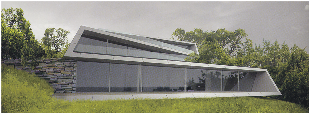
► BEEF Architects Villa 4V: kuidas vaadata Slovakiast Austria metsi.