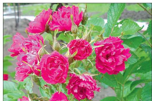
Kurdlehine roos 'F. J. Grootendorst'.

Eriti tüütu on see, kui võrsed kasvavad teiste põõsaste sisse või lillepeenrasses. Sellepärast vanad pargiroosid