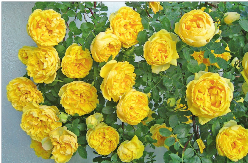
Kollane Rosa foetida õitseb ülikalduvalt, aga ei lõhna just meeldivalt.