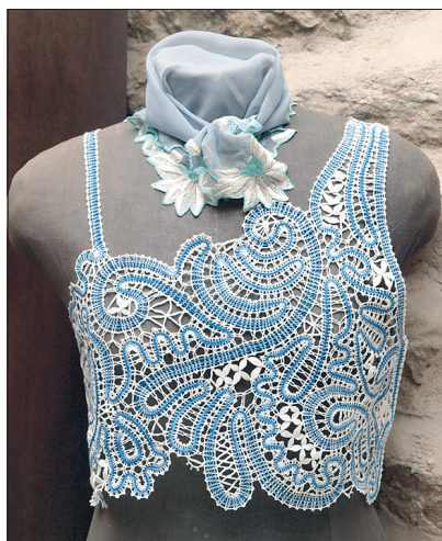
Õhtune õhuke vest.