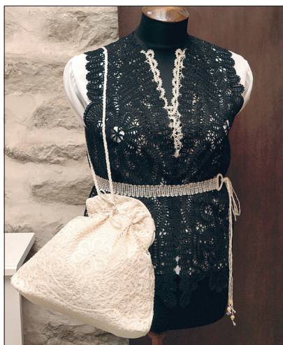
Kott, vest ja vöö.