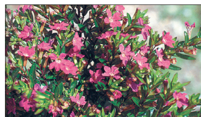
Iisopilehise sigaretilille sort 'Ruby Glow'.

Kõik kolm liiki eelistavad toitainerikast pinnast ja päikesepaistelist sooja kasvukohta, kuid lepivad ka viltsamate tingimustega. Avamaal nad ei talvitu. Neid on kerge seemnetega paljundada, varase tulemuse saamiseks tuleb külvata kasvuhuonesse juba alates veebruarist, mai lõpus