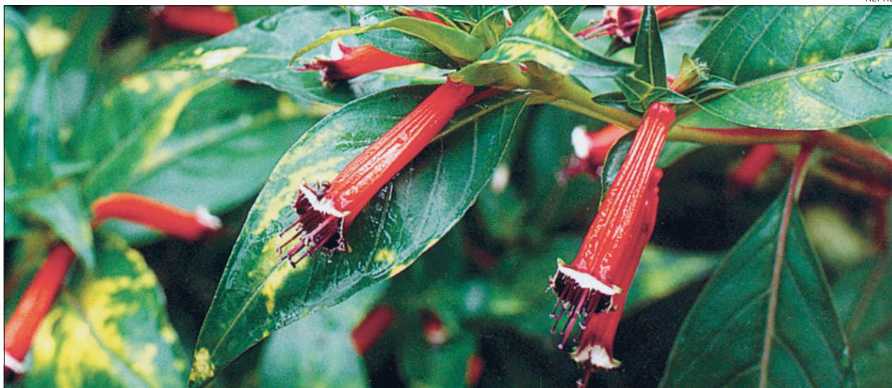
Tulipunase sigaretilille kirjulehine sort 'Variegata'.