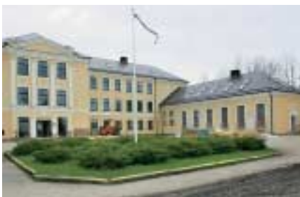
Peahoone renoveerimine maksab üle 18 miljoni krooni.

õppekavad täies mahus õpetamiseni ning õpilaste arv on siis 850–900. Kui meiega ühendatakse Vana-Antsla Kutsekeskkool, suurendab see õpilaste arvu veel 250 võrra."