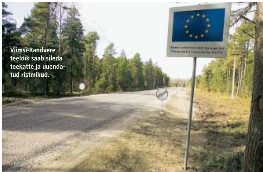
Viimsi-Randvere teelõik saab sileda teekatte ja uuendatud ristmikud.