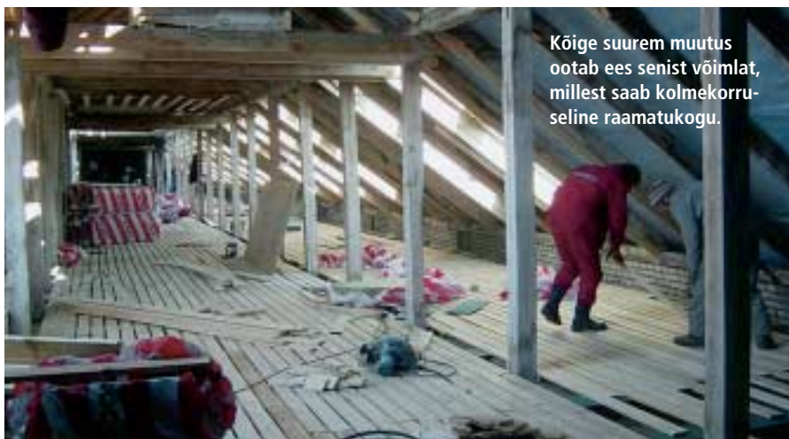
Kõige suurem muutus ootab ees senist võimlat, millest saab kolmekorruselise raamatukogu.