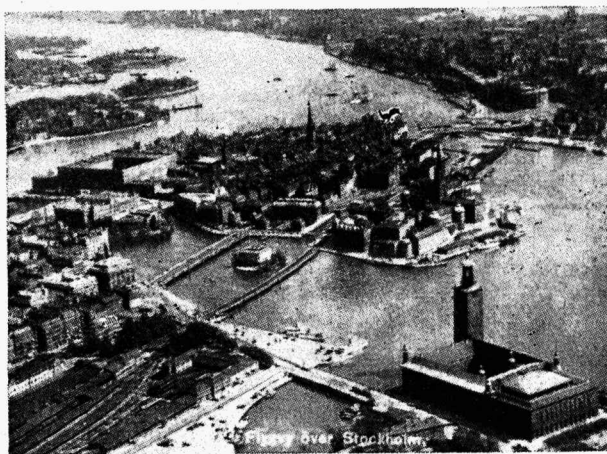
Vaade Stokholmile. Siin peatus ja ööbis Eesti sk. Jamboree meeskond esimesena, pärast Eestist ärasõitu.

ges" oli dekoratsiooniks ehitatud erilise värava milles välisseinad olid dekoreeritud nii, et päikese käes otse kohutavalt särasid ja hiilgasid. Küllastasin ka loomaaeda ning botaanikaeda. Loomaaias võivad igapäev teatud kellaegadel väikesed lapsed ja ka täiskasvanud sõita elevandi ja kaheküüruga kaameli seljas või ponidega sõita aias ringi vilunud juhiga. Juhtusin parajasti tiigrite söötmist pealt nägema. Parlamendihoone on ehitatud uues