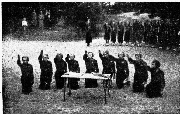
Tallinna gaidid Saaremaa laagris 1937. a. suvel töötust andmas.