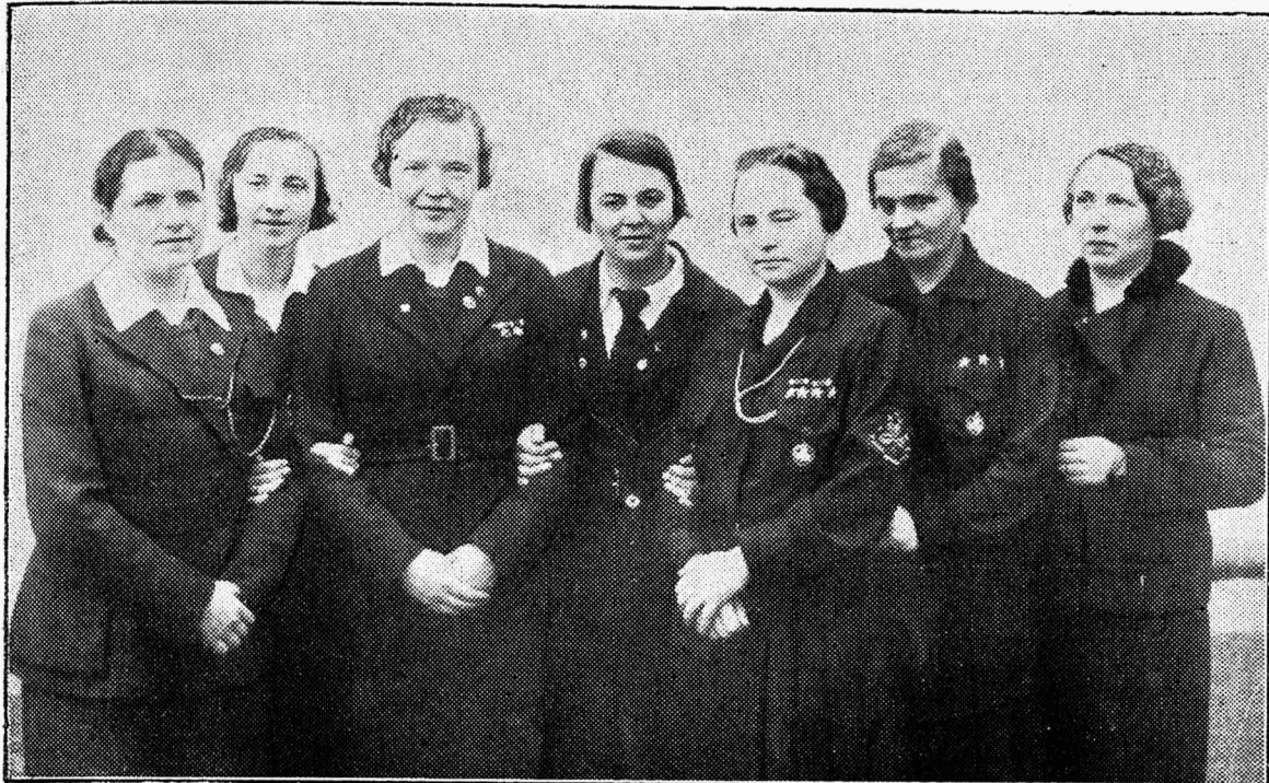
Eesti-, Läti- ja Leedu gaidjuhid Tartus Balti gaidide sõprusliidu loomise nõupidamisel.