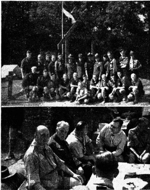
Ülal: Hollandi Jamboree Eesti laagri värv ja osavõtjad.