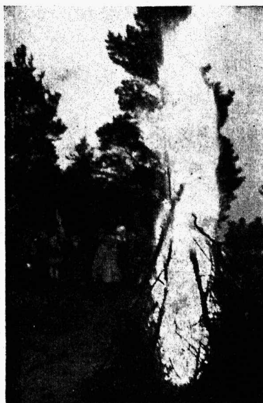
Talinnas gaidide lõksetuli Mändjalas Saaremaal.

Ei tohiks kaugel olla aeg, kus tööandjad — olgu kas vast. asutised, töökojad või eraisikud — veendumusele jõuavad, et skautlikult kasvatuselt tulnud noored üldiselt on tahtejõulised, elurõõmsad, töökad, intelligentsed ja usaldusväärsed.