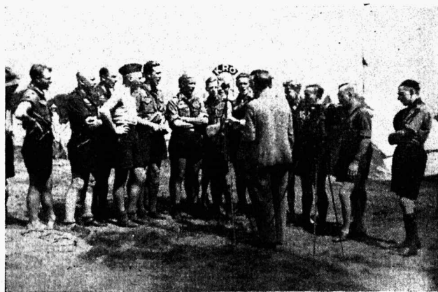
Eesti skaudid Hollandi jamboreel laulmas Hollandi ringhäälingusse.