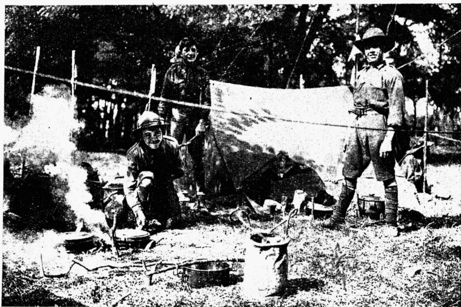
Prantsuse skoudid laagris.