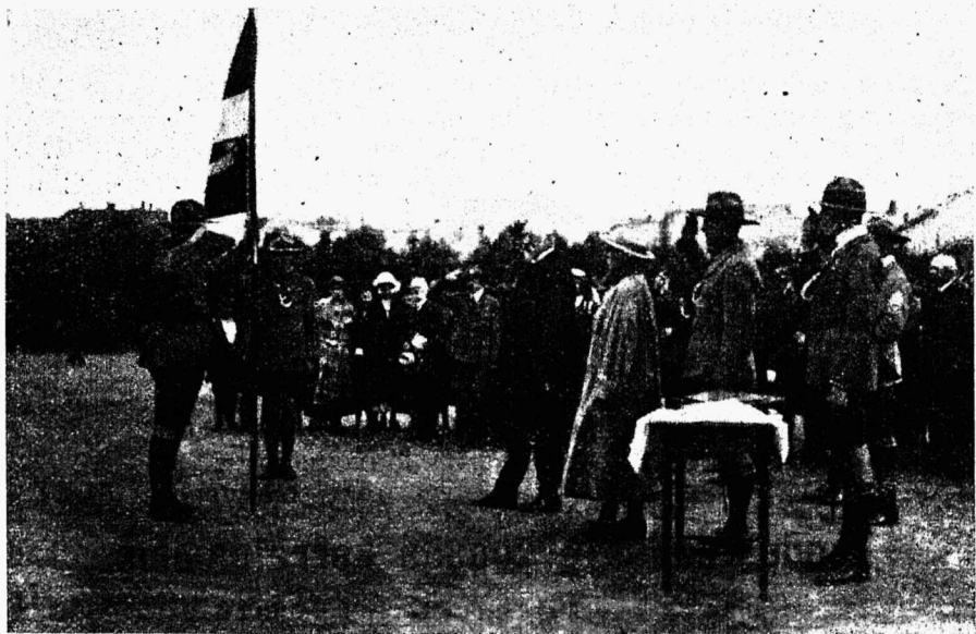
Latvija skoutidest: Vabariigi president Tshakste annetab Latvija skoutide juhatajale, kindral Hopper'ile lipu 2. aug. 1923.

Suurem osa putukaid püüetakse näppudega. Liblikaid ja teisi ruttu lendavaid putukaid püüetakse kahaga. Lillel istuvale putukale tuleb nii läheneda, et püüdjä vari putuka pääle ei langeks, kaha aegamööda ta-