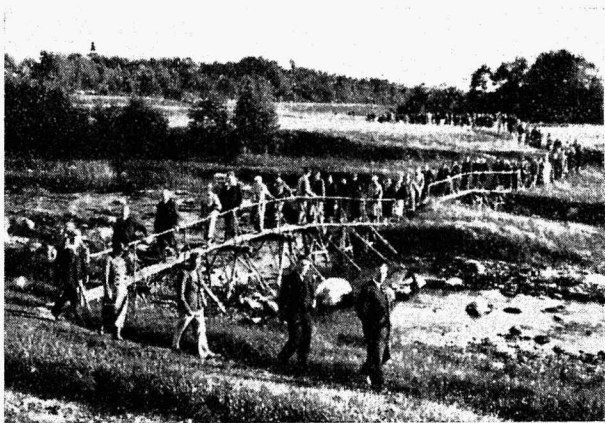
ENPR 1938. a. suvikonverentslased lähevad külastama Vabariigi Presidendi talu. Käiakse ridaslikku, et vältida heinamaa tallamist.

Konverentsist osavõtjate registreerimine toimub juuresoleva registreerimis-