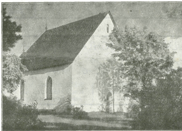
Vormsi kirik — Vanimaid kirikuid Eestis.

Haapsalu Linna Muda- ja Meresupelasutuse