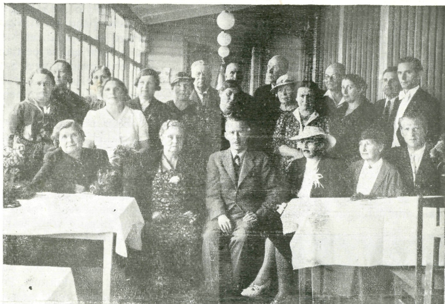
Ülesvõtte kauaaegsete suvitajate austamisaktuselt Kuursaalis 20. juulil s. a.

teostanud. Lossi rakendamine praktiliseks või kultuuriliseks otstarbeks on vaieldatav küsimus, millel oma pro'd ja contra'd. Esteedile on lossi säilitamine praeguses seisukorras — romantilise varemene ainuvastuvõetav lahendusviis.