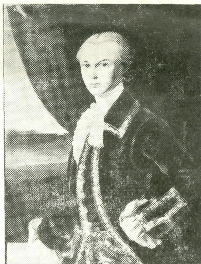
Ungru krahv — õlimaal Haapsalu muuseumis.

med tahaksid ometi kõike seda jutustada, mis nad omal ajal näinud ja mis neisse pannud tallele omal ajal elanud inimesed, et oma soove, maitset ja tegusid jäädvustada tulevastele põlvedele.