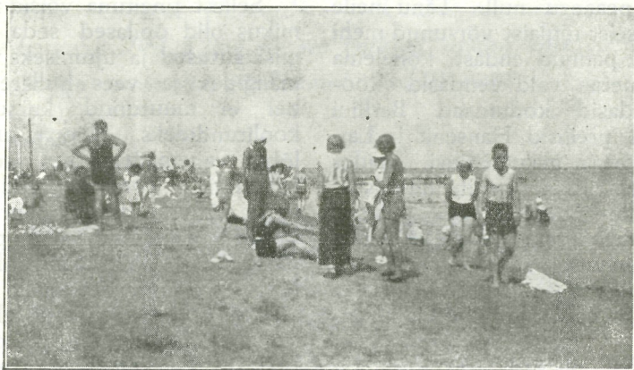
Plääs suvisel keskpäeval.