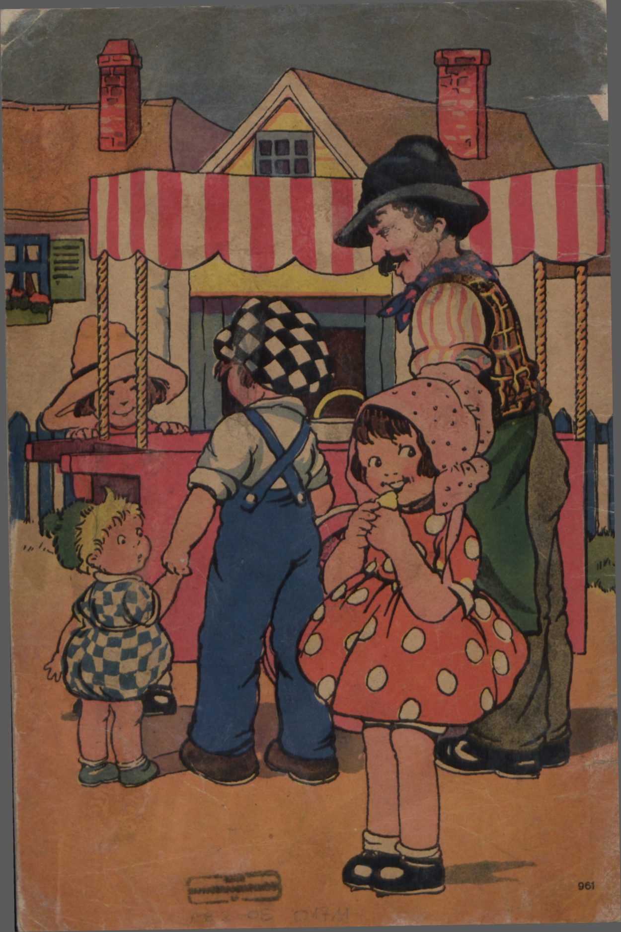
Illustration by [illegible]