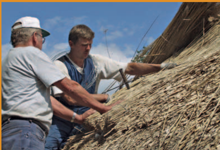
Projekt „Rahvakultuurid kohtuvad“