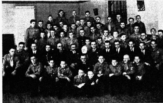
Võru maleva juhtide koolist osavõtjad.

vormi, korraldas aastapäeva puhul tasuta teelaua ja korraldab praegu rühmale lipu muretsemist.