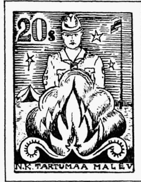
Tartumaa maleva laagrimarke.

4. Ettevalmistamata või vähe ettevalmistatud avalik lõkktule ei õnnestu isegi vilunud juhtide osavõtul, kõnelemata poistest. Sellepärast oleks väga soovitatav korraldada õppe- kui ka harjutuslaagrites eeskujulikke avalikke lõkktuleid, millised oleksid kaalutud ja ettevalmistatud kavaga. Otsekohene loomingu lõkktule puhul peab piirduma ikkagi peamiselt hüüetega sobivatel kohtadel, kusjuures vastastikused hüüded võivad kujuneda väga elavateks ja huvitavateks. Oleks isegi mõeldav harjutuslaagrite kavasse võtta teoreetilisi arutlusi lõkktule korraldamise kohta, kõneldes mitmesugustest lõkktule kujutamise moodustest, õhtu sisustamise üksikasjadest, tehnilisest külast jne.