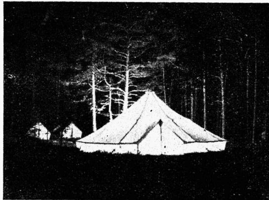
Tartu H. Treffneri gümn. mvk. hiigeltelk, mahutab magama 60 noorkotkast.