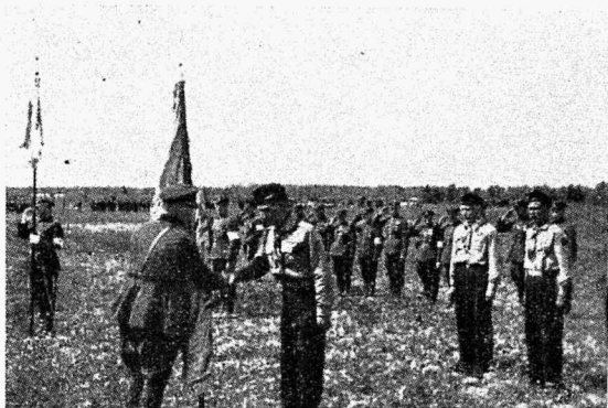
Kaitseliidu ülem annetab lipu Paide malevkonnale

Kuusteist silma on enam kui kaks ja kaheksa pead leiutab enam häid ideid salga heakäekäiguks, kui salgapealik üksinda kunagi suudaks leida. Töötades koos iga mees leiab end olevat vajaliku osa organisatsioonis. Ja töötades käsi-käes oma juhiga nad arendavad oma ise-loomu ja arenevad kohustetäitmisel ja teadmistes.