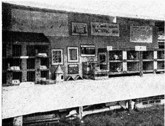
Peastaabi sidetuvila väljapanekuid näitusel.

Kodutütarde Pärnumaa ringkond korraldab rühmavanemale, rühmajuhitidele ja salgajuhtidele õppepäeva 31. oktoobril