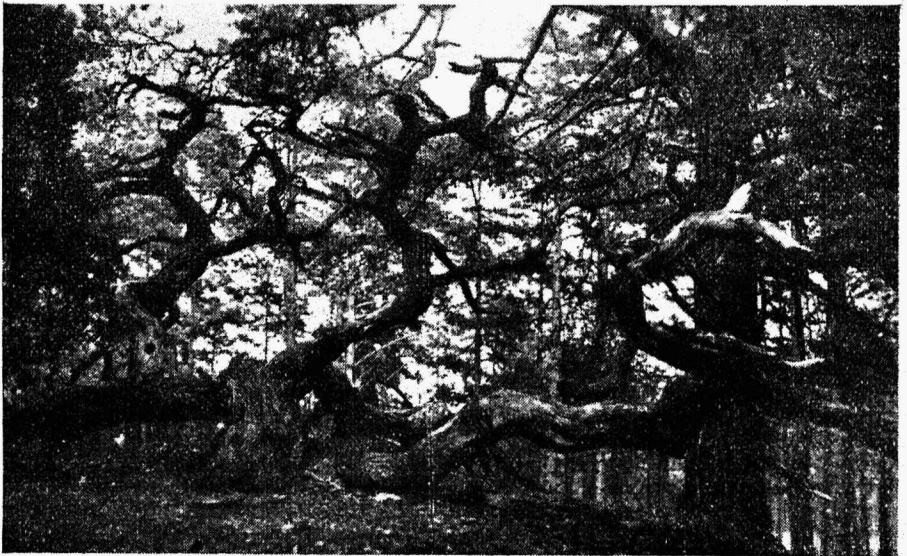
Muhu-Madli mänd Mustjalas (Saaremaal).