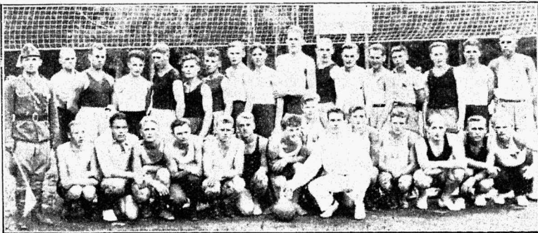
ÜENÜ Viru võrkpalli meistrivõistlustelt Porkunis 1934 a.

Jääb vaid soovida, et kõigi liikmete ühine tegevusvaimustus ei raueks, vaid et ühistunne veelgi süveneks ja ÜENÜ Naistevälje-Nõmküla osakond kujuneks teiseks koduks kõigile ümbruskonna noortele, aidates rühkida kultuursema külaühiskonna poole. —E.—E.—