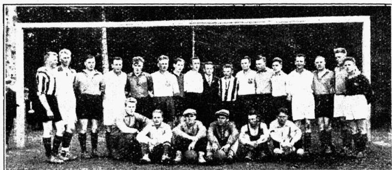
ÜENÜ Tamsalu ja Rakke osak. jalgpallimeeskonnad spordiväljal avamisel 2. juunil 1935 a.

Referaat-vaieulusõhtuist õnnestunumaks võib pidada 11. mail korraldatut, kus