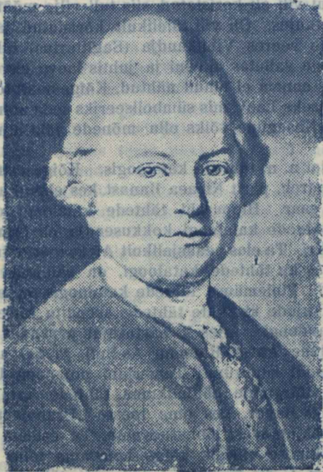
Gotthold Ephraim Lessing, suurem Saksa dramaatik ja kriitik, kelle 200 aastast sünnipäeva hiljuti mälestati.