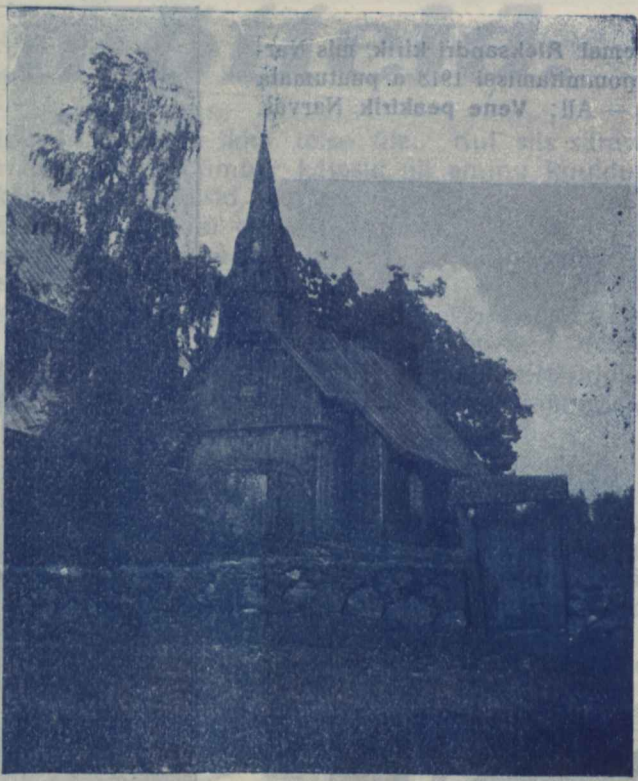
Vana puukirik Ruhno saarel.

Korraga, tol jõulu õhtul, kõlasid tulekahju kellad, oigasid vileid ja tuututasid sarved... Tuli oli lahti pääsenud Joaorus, Raja tänaval. Ainult nilpasid tulekeeled palke, neid ragistades ja vurisedes süües. Heledalt välgatasid pritsimeeste kiivrid. Kuuld tuli on vägev. Ta ei jäta midagi, ja ka nüüd ta ei hoolinud. Jõuluõhtul tuli ta. Hävitas varanduse, jättes inimesed abitult tänavale. Öudne oli see pilt. Sünkjas taevas, lõõmavad tuleleegid, häviva varanduse omanikude meelega... Mis on see vaene rahvas! Elu vastu patustanud, et ta neid nii karmilt nuhtleb?!