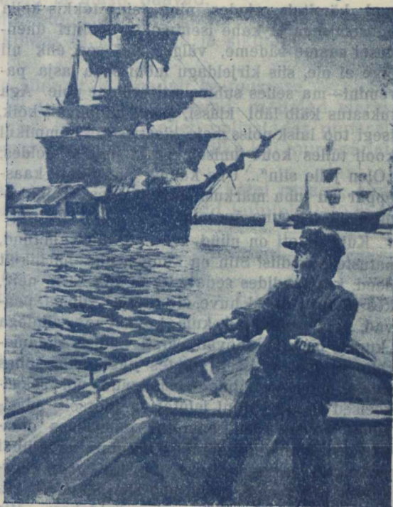
A. Edelfelt'i „Meremees“.

Vabadussõja kulud ja rasked ohvrid tasub aga tuhandevõrra see suur võit, mida tunneme juba üheteistkümnendat aastat vabadusena ja riikliku iseseisvuseks.