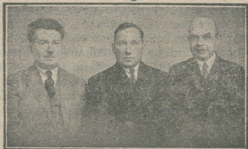
Pärnu Majanduse Ühisuse juhatus.