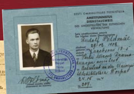
Kultuuriloolase Rudolf Põldmäe saksa okupatsiooni aegne Tartu Ülikooli töötõend.