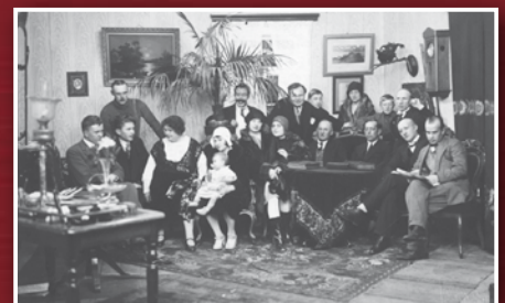
Grupp Eesti filminäitlejaid. I reas paremalt 3 operaator K. Märška. (1929)