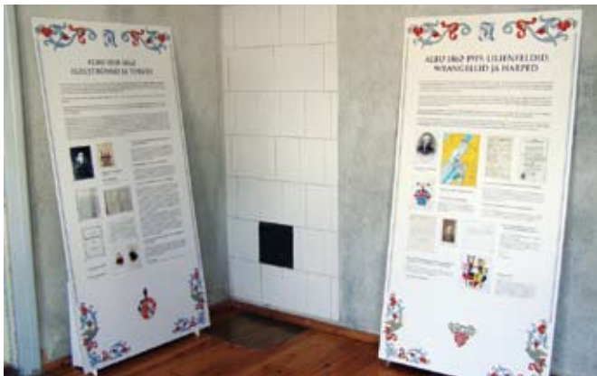
Näitusestendid Albus.

2005. aasta kevadtalvel algas deklareeritud ülesannete elluviimine Kiltsi põhikooli kui ühe aktiivsema ning koloritsemata mõisakooli näitel. Suvel toimus Kiltsis ajalookonverents, kus teiste seas esinesid Ajalooarhiivi materjalidele tuginevate uurimistöödega neli Kiltsi põhikooli õpilast. Samas avati ka pidulikult püsinäitus «Kiltsi mõis ja admiral A. J. von Krusenstern» ning esitleti näitusematerjalide põhjal valminud eesti- ja ingliskeelset Kiltsi mõisa ajalugu tutvustavat voldikut. Septembri lõpus toimus Kiltsi põhikooli õpilaste õppekäik Ajalooarhiivi. Sellega oli pilootprojekt edukalt lõpetatud.