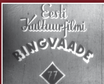
Filmitootja «Eesti Kultuurfilmi» logo. EKF nr 61, 1935