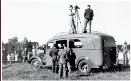
«Eesti Kultuurfilm» filmigrupi võtetel (1936)