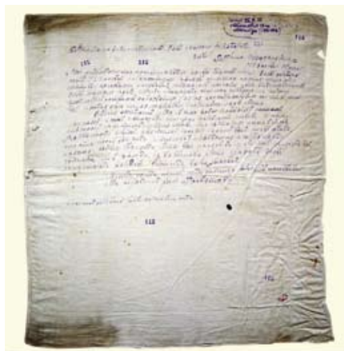
Salakirjaga taskurätik, saadetud Tallinna Keskvanglast 19. aprillil 1925.

Sarnaseid, samavõrra huvipakkuvaid arhiivileide õnnestuski Arhiiviminutite käigus avalikkusele tutvustada. Nii saatejuhtidele saabunud kirjade, arhiivi tehtud telefonikõnede kui ka vahetute kontaktide põhjal võib öelda, et televaataja pani arhivaale teraselt tähele, näidatu ja jutustatu oli haarav ning positiivse mõjuga. Sujuv ja äärmiselt sõbralik koostöö arhiivide ja televisiooni vahel on kahtlemata veel üks telehooaja iseloomustajatest. Siinkirjutajad koos kõigi kaastöölisega tänavad Eesti Televisiooni Tartu stuudio abivalmis meeskonda!