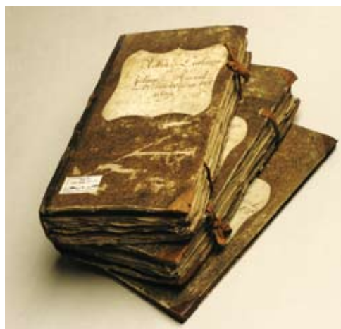
Mõned Pärnu linnatolli põhižurnaalid.

Pärnu linnatolliraamatud 18. sajandi teisest poolest pakuvad detailset informatsiooni Pärnu sadama kaudu toimunud ekspordi ja impordi kohta peaaegu 20aastase perioodi jooksul (1764, 1766–1782). Pärnus kasutati linnatolli ( Stadtzoll ) asemel nimetust lisatoll ( Zulage-Zoll ). Linnatolli žurnaalid, v.a 1764. aasta oma, koosnevad kahest osast, nn. põhi- ja lisažurnaalist. Põhižurnaal sisaldab järgmisi andmeid: laevniku nimi, laeva lähte- ja sihtkoht, kaubaomaniku nimi ja sageli lühendatud nimekiri transporditud kaupadest. Lisažurnaalid on põhižurnaalidest märksa mahukamad, sisaldades laevnike või sadamaametnike koostatud koondaruandeid laeva parameetrite (tüüp, süvis, purjede arv, nimi), meeskonna ja lasti kohta ning kaubaomanike detailseid aruandeid imporditud või alates 1777. aastast eksporditud kauba kohta. Mõned lisažurnaalid pakuvad teavet ka meritsi Pärnusse saabunud inimeste, eelkõige käsitöösellide kohta.