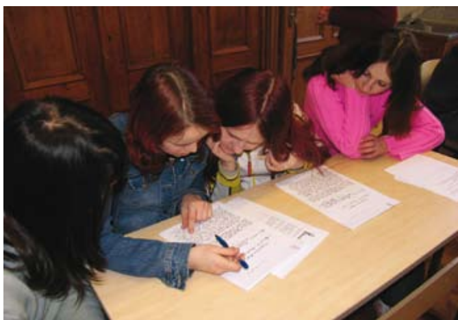
Arhiivitund Mooste põhikoolis.

Kui 1920. aastatel asuti maareformiga riigistatud mõisahoonetele uusi rakendusi otsima, kujunes üheks valdavamaks lahenduseks nendesse koolide paigutamine. Nii koliti tollal endistesse mõisahoonetesse ligi 300 eri liiki kooli ning sündisid mõisakoolid, taolist nimetust nende kohta hakati sihikindlalt kasutama küll alles 1990. aastatel. Ehkki nõukogude perioodil rajati palju uusi maakoolimaju, mis vastasid koolide vajadustele vanadest mõisahäärberitest märksa paremini, ei kadunud päriselt ka mõisakoolid. Täna tegutseb endistes mõisahoonetes veel 62 kooli.