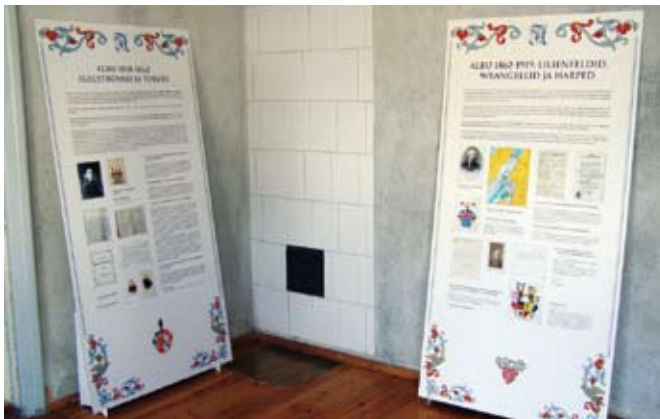
Näitusestendid Albus.

2005. aasta kevadtalvel algas deklareeritud ülesannete elluviimine Kiltsi põhikooli kui ühe aktiivsema ning koloritsemä mõisakooli näitel. Suvel toimus Kiltsis ajalookonverents, kus teiste seas esinesid Ajalooarhiivi materjalidele tuginevate uurimistöödega neli Kiltsi põhikooli õpilast. Samas avati ka pidulikult püsinäitus «Kiltsi mõis ja admiral A. J. von Krusenstern» ning esitleti näitusematerjalide põhjal valminud eesti- ja ingliskeelset Kiltsi mõisa ajalugu tutvustavat voldikut. Septembri lõpus toimus Kiltsi põhikooli õpilaste õppekäik Ajalooarhiivi. Sellega oli pilootprojekt edukalt lõpetatud.