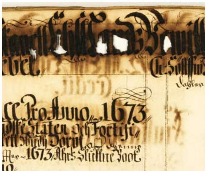
Raudgallustindi korrosiooni kahjustus Eestimaa rootsiaegse kindralkubeneri fondis (EAA 1-2-832).

MIPi koostöövõrgustikku kuulus 21 ametlikku liiget 11 riigist. Nende hulgas neli rahvusarhiivi (Rootsi, Eesti, Slovakkia ja Hollandi), kuus ülikooli (Rootsist, Slovakkias, Suurbritanniast, Poolast, Sloveeniast ja Prantsusmaalt), kolm uurimisinstituuti (Hollandist ja Itaaliast), kaks raamatukogu (Norrast ja Sloveeniast), kaks muuseumi (Hollandist ja Hispaaniast), kaks konserveerimistehnoloogia tootmisega tegelevat firmat (Saksamaalt ja Hollandist), üks Soome konserveerimisalane kõrgkool ja üks Prantsusmaa konserveerimiskeskus.