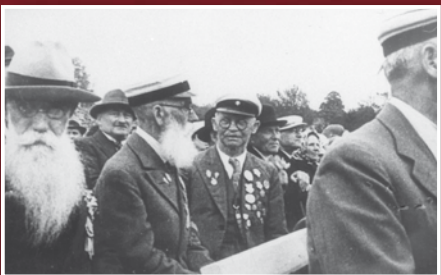
XI Üldlaulupeo veteranid. Kaader filmist EKF rv. nr 27, 1938, Tallinn