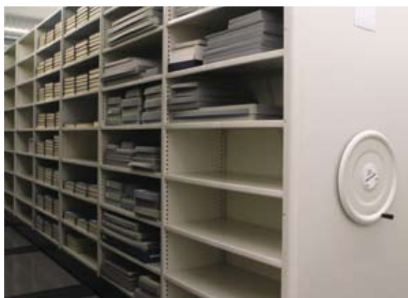
Pärgamendil arhivaalide hoiustamine.