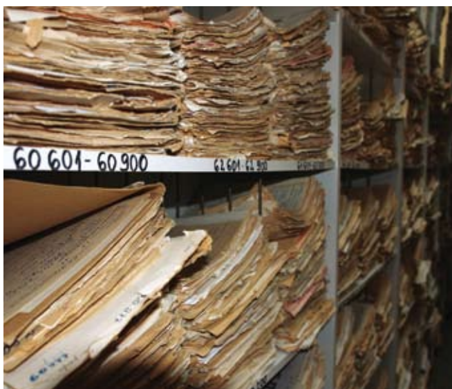
Pilk Tartu Ülikooli registratuuri, numbrid riulitel räägivad ise enda eest.

Üldhindamisotsused on oma olemuselt eelhindamise otsused. Selliseid hindamisi on otstarbekas läbi viia sarnastele dokumendisarjadele ja -liikidele, mis tekivad ühesuguste ülesannete täitmise käigus erinevate arhiivimoodustajate juures. Üldhindamisotsused hoiavad oluliselt kokku arhiivide ajaressurssi ning ühtlustavad kogu Rahvusarhiivi hindamispraktikat tervikuna.