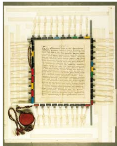
Pärgament kuivamas (EAA 1862-4-150).

Arvestades pärgamendikollektsiooni kuuluvate arhivaalide ajaloolist ja kultuurilist väärtust, otsustati teostada kollektsiooni kui terviku füüsilise seisundi analüüs, hõlmates eraldi kõiki säilikuid. Uuringu eesmärk oli saada terviklikum ja täpsem ülevaade kogust ja selle seisundist, et tulevikus hinnata konserveerimise toimet ja efektiivsust; selgitada, millised on levinumad kahjustuste liigid ja põhjused, kui suur on kahjustatud säilikute hulk, millele edasisel säilitamisel pöörata tähelepanu ning milline osa kogust vajab tulevikus täpsemaid uuringuid või perioodilist ülevaatus. Pärgamendikollektsiooni füüsilise seisundi uuringu aluseks võeti «Parchment Assessment Report», mis töötati välja rahvusvahelise projekti IDAP ( Improved Damage Assessment of Parchment ) poolt. IDAP-projekti raames töötati aastatel 2002–2005 Taani Kuningliku Kunstide Akadeemia Konservatorite Kooli eestvedamisel ja seda finantseeriti Euroopa Komisjoni poolt. Seisundiuringu andmed sisestati andmebaasi.