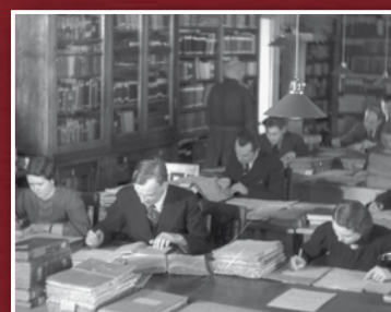
Riigi Keskarhiivi lugemissaal. Kaader filmist EKF rv. nr 13, 1938