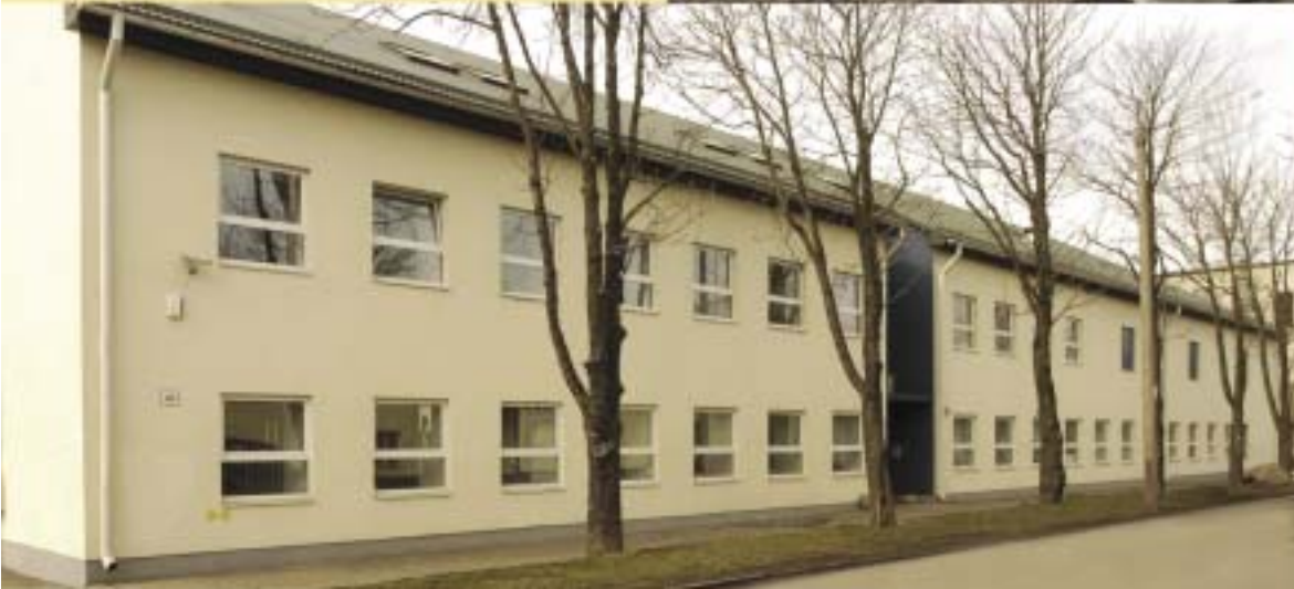
Riigiarhiiv Madara 24