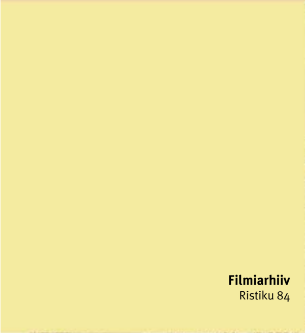
Filmiarhiiv Ristiku 84