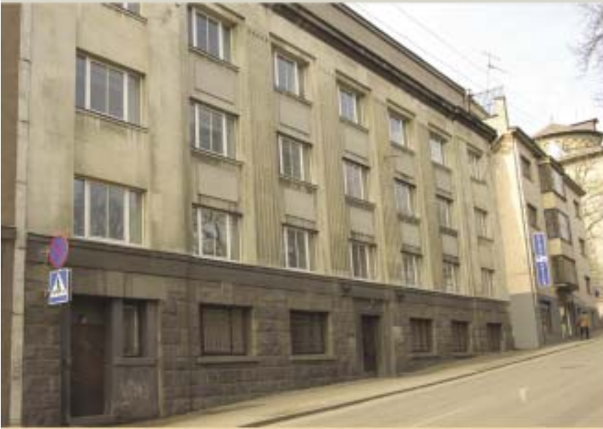
Riigiarhiiv Tõnismägi 16