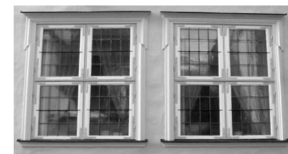
18. saj. Uus tn. 15, Tallinn

Alates 18. saj. oli aknaklaas kõigile kättesaadav. Mingil määral jõukuse märgiks jäi see aga nüüdki. 17. ja 18. saj vältel muutusid aknad järjest suuremaks.