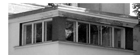
Funktsionalistlikud aknad Toompuiestee 6, Tallinn

1920–30datest aastatest alates muutus akende vorm üha lihtsamaks. Moeuudiseks sai kitsas lintaken.