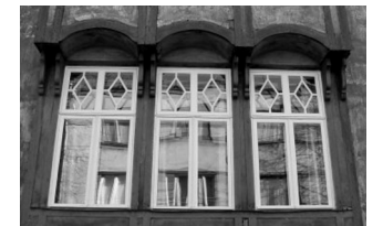
Peeter Süda tn. 3A, Tallinn

Elamute juures iseloomustab juugendperioodi akna ülaosa ruutudeks jaotamine.