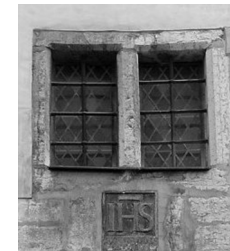
Vanaturu kael 3, Tallinn

Esimesed klaasaknad ilmusid tõenäoliselt juba 13. saj. Kuna klaas oli luksuskaup, võisid seda oma majale lubada vaid jõukamad kodanikud. Keskaegne aknaklaas oli paks ja puhumisel tekkinud mullide tõttu üsna läbipaistmatu. Tolleaegsest tehnoloogiast tingituna olid klaasiruudud väiksemõõdulised (u. 15x10 cm). Ruudud ühendati omavahel tinaribadega. Algselt kinnitusid tinaraamid aknad kivist piitade külge ning neid ei olnud võimalik avada.