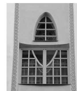
Juugendaken Pärnu mnt. 67, Tallinn

Elamute juures iseloomustab juugendperioodi akna ülaosa ruutudeks jaotamine.