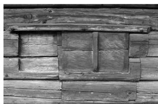
Kolga talu rehelielamu lükandluugiga aken, Tilga küla, Hiiumaa, EVM

Meie vanim elamutüüp – püstkoda – oli akendeta. Valgust saadi ukse- ja suitsuava kaudu. Esimesed aknad kujutasid endast kahe seinapalgi vahele raiutud nelinurkset ava, mis suleti puust lükandluugiga. Esines ka puust või metallist hingedel pööratavaid luuke ning saartel ka äratõstetavaid luuke. Sellised klaasimata avaused täitsid lisaks valgustamisele ka suitsu ja vingu väljajuhtijate funktsiooni.