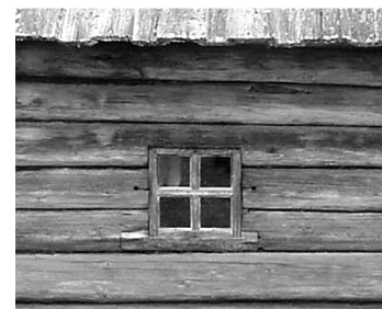
Kolga talu saun-suveköök, EVM

Aknaklaasi eellasteks olid loomapõis, vasikanahk või riie. Taludel hakkasid klaasitud aknad levima 19. saj. I poolel, Saaremaal veidi varem – 18. saj. lõpul. Alguses olid need väikesed – nelja ruudu ja u. 0,3m 2 pindalaga. Et tuul pragudest läbi ei puhuks, tihendati aknad algul saviga, hiljem linaõli-värnitsast ja kriidist valmistatud kitiga.