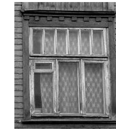
Tatari tn. 42, Tallinn

Koos kasvava hügieeni- ja tervishooldusega ilmusid akendele eraldi avatavad tuulutusraamid.