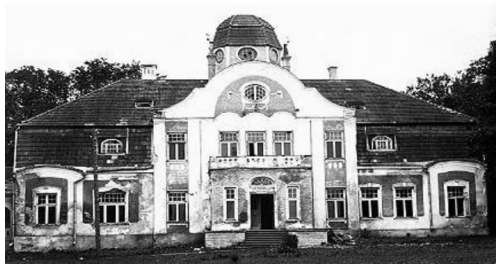
Kiiu mõis