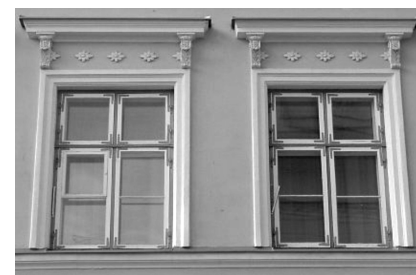
Vene tn. 19, Tallinn

19. saj. sai valdavaks 6-ruuduline aknatüüp. Üha olulisemaks muutus ruumide valgusküllasus. Loobuti väikeseruudulistest akendest.