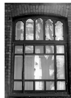
Historitsistlik aken Sakala tn. 23, Tallinn

19. saj. lõpus ja 20. saj. alguses omandasid esinduslikemate hoonete aknad historitsismile ja juugendile omased vormid.