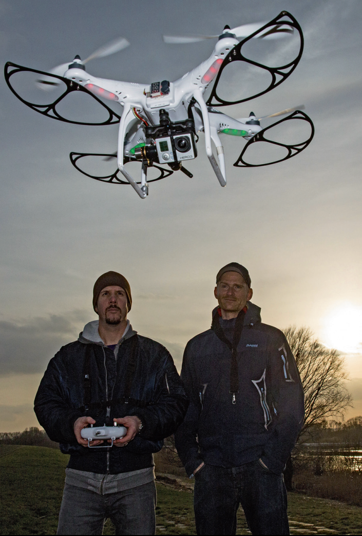
Üleval droonijuht, kelle käe all pildistab droon tema ees laiuvat maa-ala. Paremal näide sellest, kuidas viimasel Milano moenäädalal kasutati droone lavadel toimuva edastamiseks nendele, kes saalis ei viibinud.