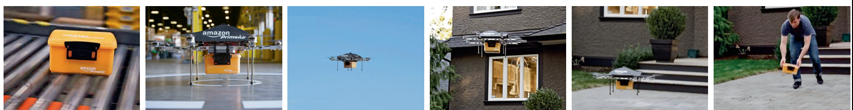
Amazon simuleerib postdroonide kasutust, mis mõne aja pärast ehk juba reaalsuseks saab. Pisikesi masinaid juhivad pardal olev kontrollpaneel ning maksimumraskuseks, mida droon kannab, on 2,5 kg (umbes 86% kogu amazon.com-i postiliiklustest).