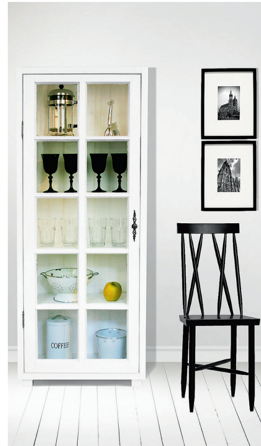
Vitriinkapp valmis vanast puhutud klaasidega aknast. Männipuust karkassi tagaseinas on laudise imitatsiooniga vineer.