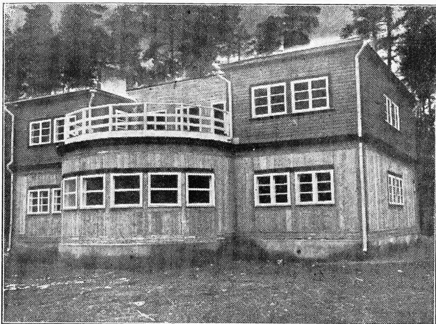
Maja fassaad platsilt vaadates.