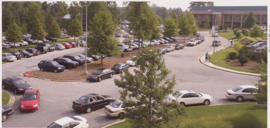
GPC looks like a small town with its streets, sideways, and, of course, a parking problem.

After two years in GPC, I can now find more strengths in EBS than I could have ever before. As I said before, bigger is NOT always better, at least when it comes to education.