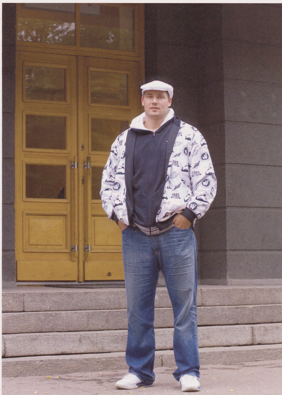
Gerd Kanter - valitsev kettaheite maailmameister.

suudaksin nii edukalt harrastada. Kettaheitteks oli mul eeldusi.