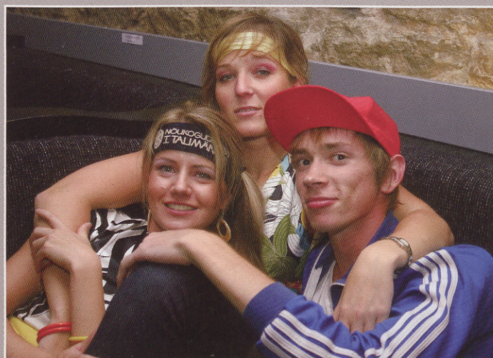
Väsinud, aga õnnelikud.