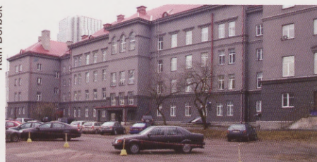
Peamiselt on EBSi parklas ruumi üle vaid nädalavahetustel.

Varem pole parkla ületäituvus nii tõsiselt probleemi tekitanud kui sellel aastal. Tänavu otsustas Tudengileht parkimisprobleemi üles tõsta, kuna kümnekond tudengit ei ole veel sügissemestri algusest saadik saanud kohtade puudumise tõttu parklakaarti osta.