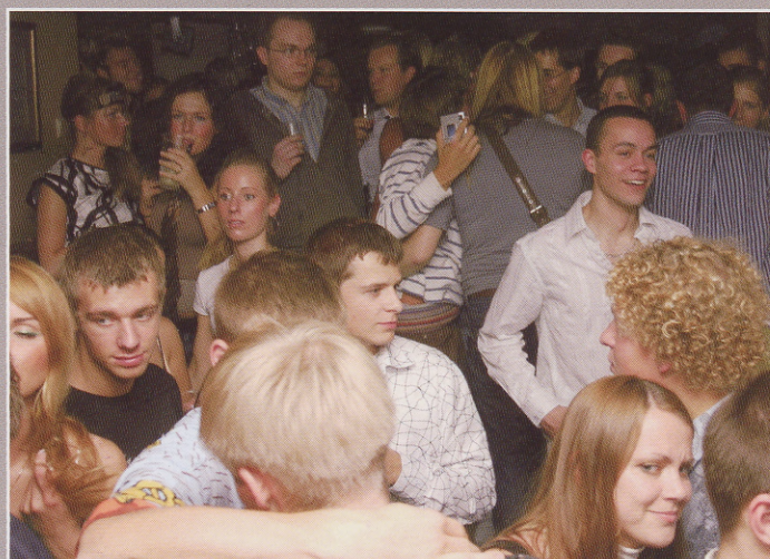
Meid oli tõesti palju.