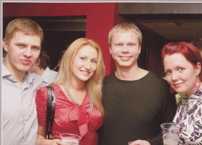
Peol oli nii tudengeid, vilistlasi, aga ka õppejõudusid.