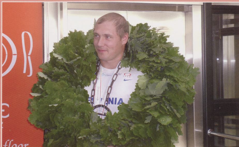
Meie tubli maailmameistrist ebsikas.