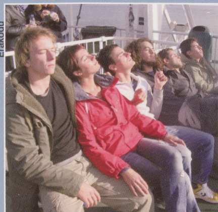
Tagasitulek Saaremaalt oli väsitav, kuid päikesepaisteline.

Saaremaa reis sisaldas looduslike paikade külastamist (Panga pank, Odalätsi allikad, Sõrve säär), kultuuriga tutvumist (Kuressaare linnus ja linn, Karja kirik, Angla tuulikud), samuti oleme alati hoolitsenud selle eest, et kõik saaksid end ise looduses leida ja endale meelepärasega tegeleda ehk siis et oleks vaba aega. Peale selle proovisime järgi kalapüügi, suitsusauna, külastasime jaanalinufarmi. Eks ööbimispaik – Pilguse mõis – on ise juba üks suur vaatamisväärsus ja koht, kus mõnusalt aega veeta.