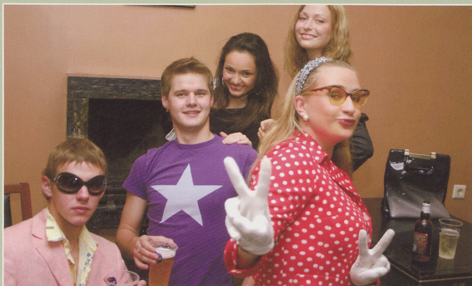
Pidu oli nii - nii hea.

Siit ka väiksed õpetussõnad: osta pilet alati eelmüügist, kui tahad EBSis lahedatest üritustest osa saada.