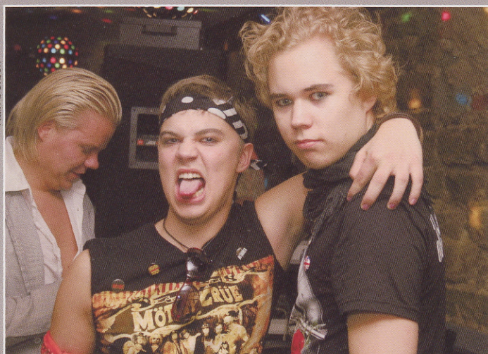
Ei puudnud ka rokiennad.