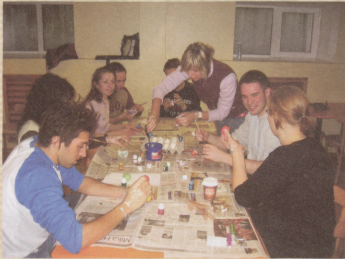
Happy Erasmus students painting their Easter Eggs