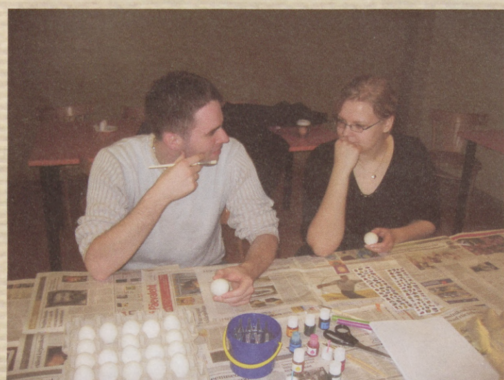
In the beginning, there has to be an idea