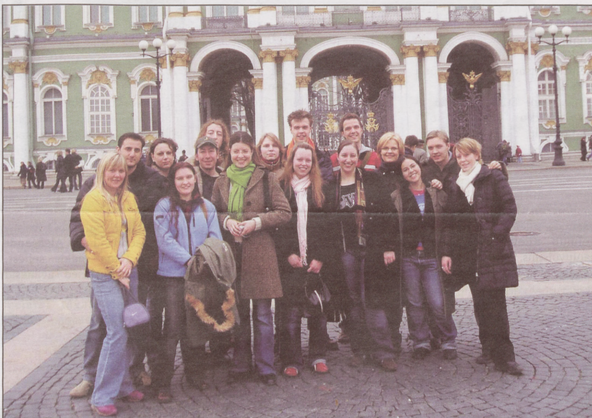
It does not matter where you are from, what matters is where you have been...

It is always good to see new countries and cultures. Russia with St. Petersburg is definitely one place in the world that is more than just worth seeing. It is city with great history and many incredible things.