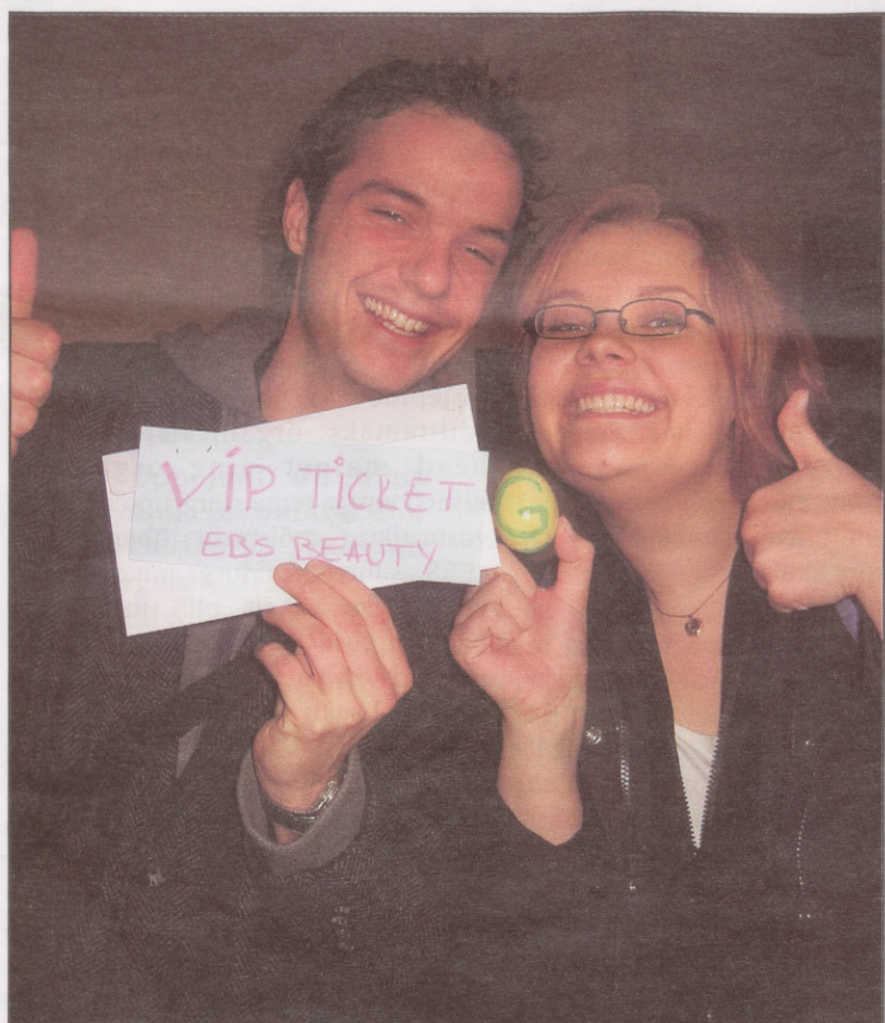
Lucky winners with their Stunningly Gorgeous Easter Egg!

We decided to keep it more positive and started to paint our gorgeous egg with stunning colours. And, although we did not expect it, we won a V.I.P. treatment during the EBS Beauty contest! Unfortunately, the egg had a short life because it fell on the dance floor in club Hollywood.