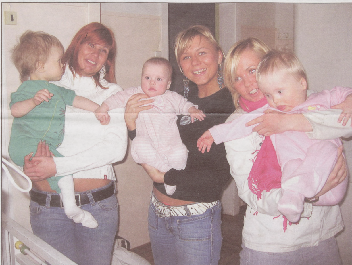
Kaunitarid ja nende väikesed uued sõbrad

Loodetavasti jätkub EBSi ja Väikemõisa väikelastekodu vaheline koostöö, juba ongi plaanis seoses Lastekaitsepäevaga külastada taas meie uusi väikesi sõpru.