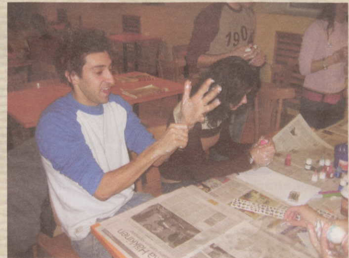
Put on the gloves and start to paint the egg as your fantasy lets you