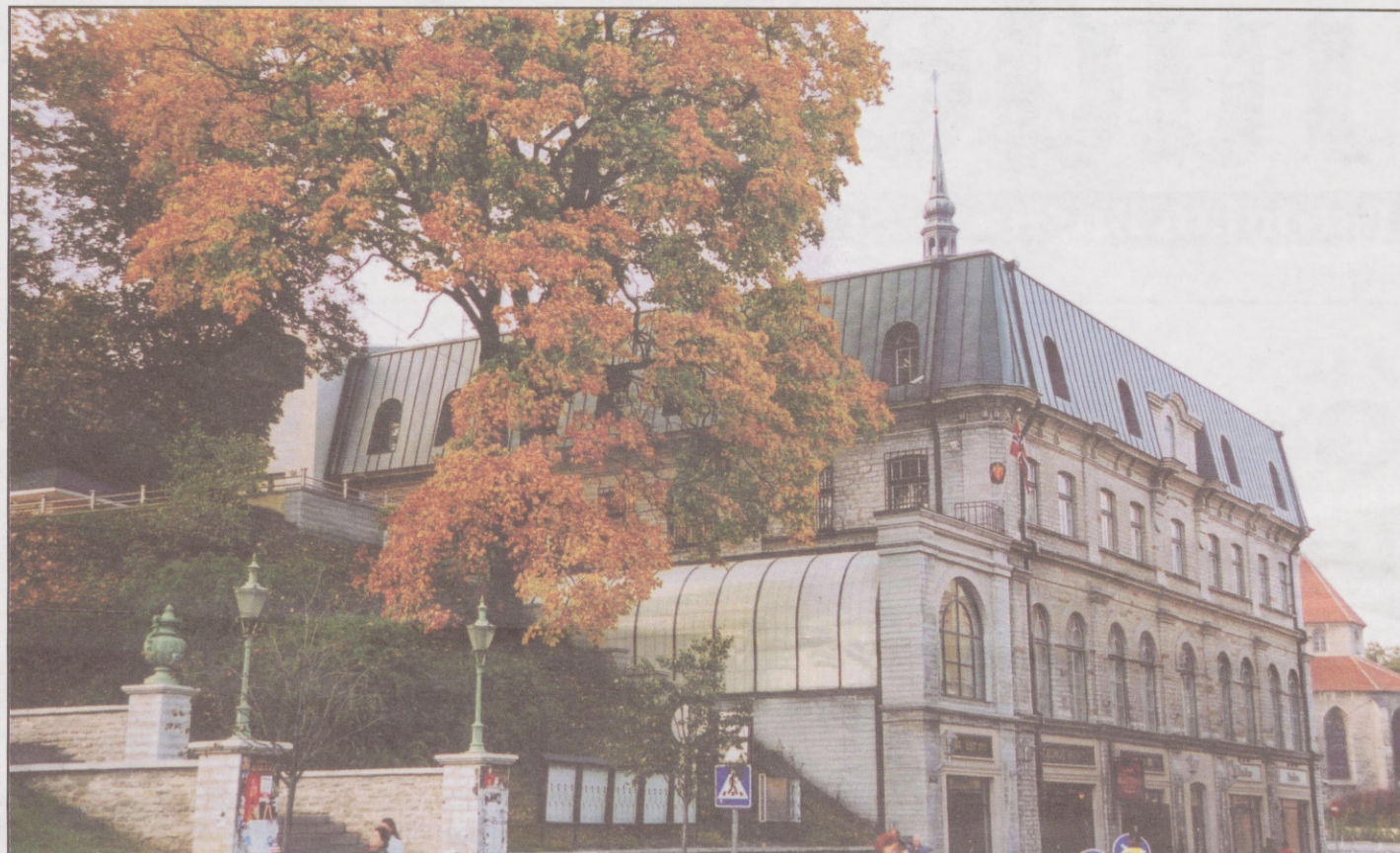
Harju 6, EBS Juhtimiskoolituse Keskus