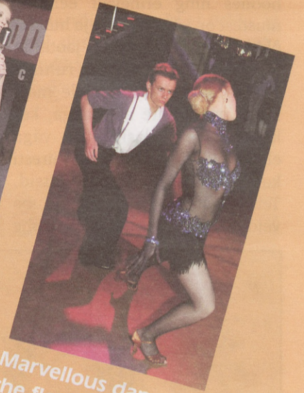
Marvellous dancers on the floor...