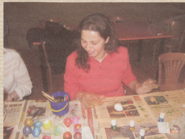
Oh, so many colorful eggs here!