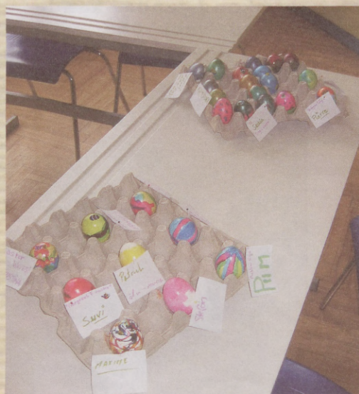
Easter Eggs Competition!