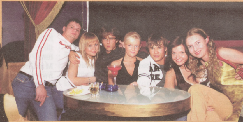
Happy guests enjoying the Beauty contest