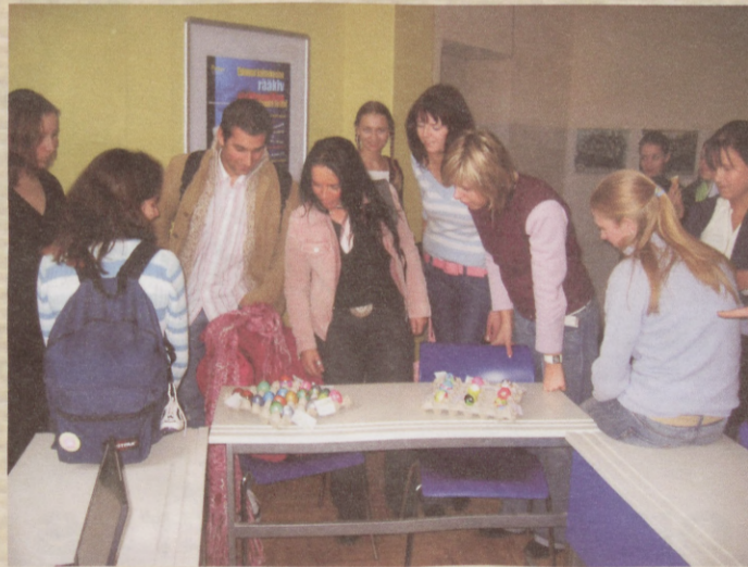
Easter Eggs Competition! Everybody is looking for their favourite egg!