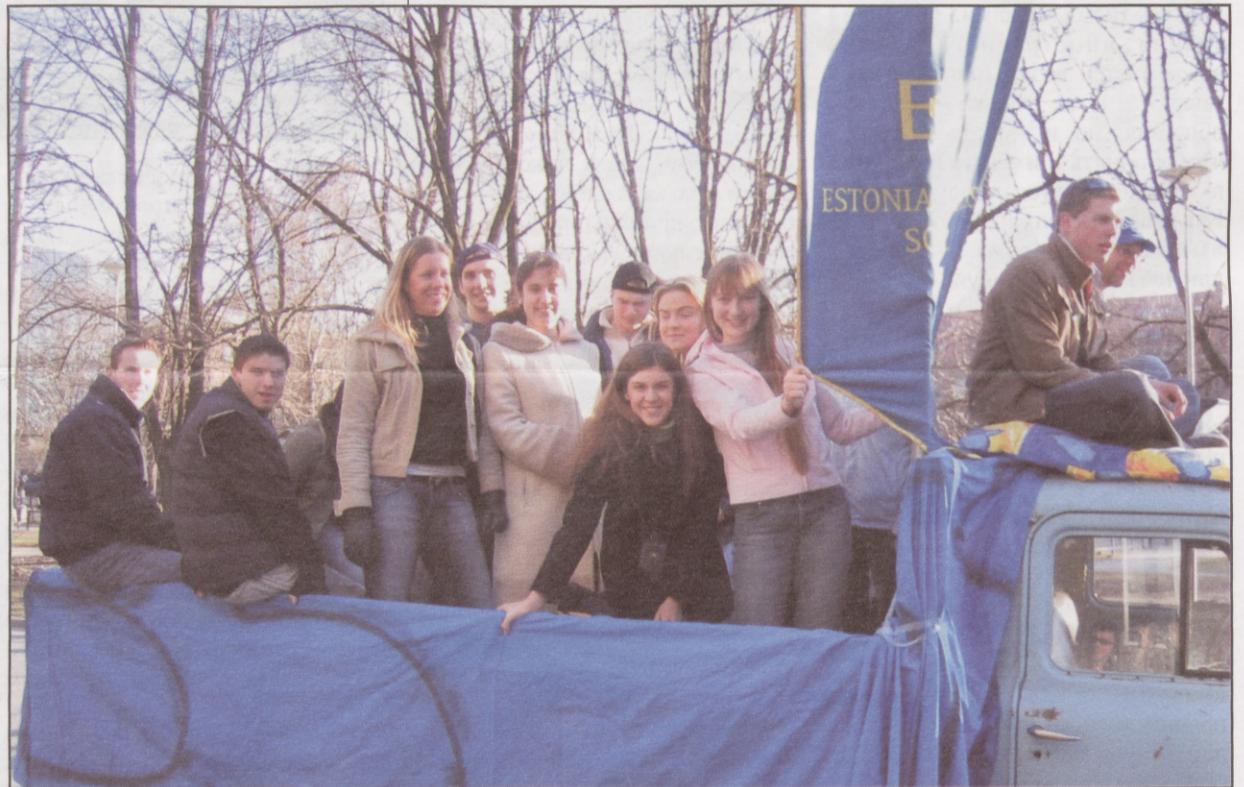
Veokitäis ebsikaid suundumas Tudengipäevadele

Tudengite Kevadpäevad Tartus on hea võimalus end välja elada ja lõbusalt aega veeta enne pingelist sessi aega. Samas on see ka hea põhjus meile tallinlastele, miks külastada Tartut, kuna olen kindel, et enamus meist sinna just eriti sageli ei satu. Tudengite päevad on mõeldud tudengite rõõmuks ja ühendamiseks kohtume siis kõik 25. aprill 1. mai Tartus Tudengite Kevadpäevadel!