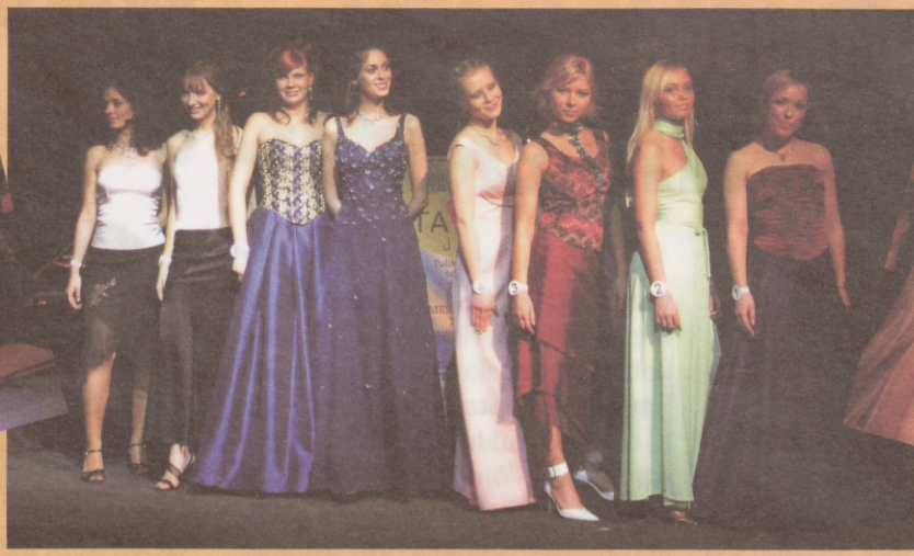
All candidates of EBS Beauty 2005