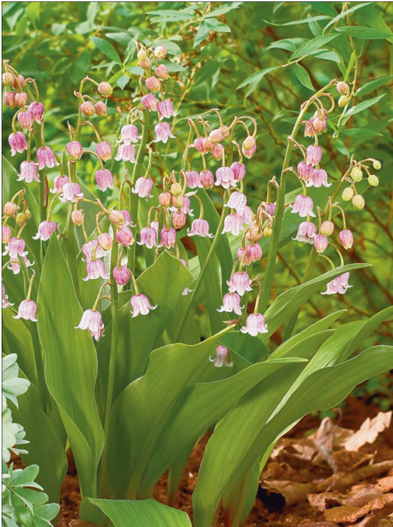
Roosade õiekellukatega 'Rosea' õitseb kahjuks vähe.