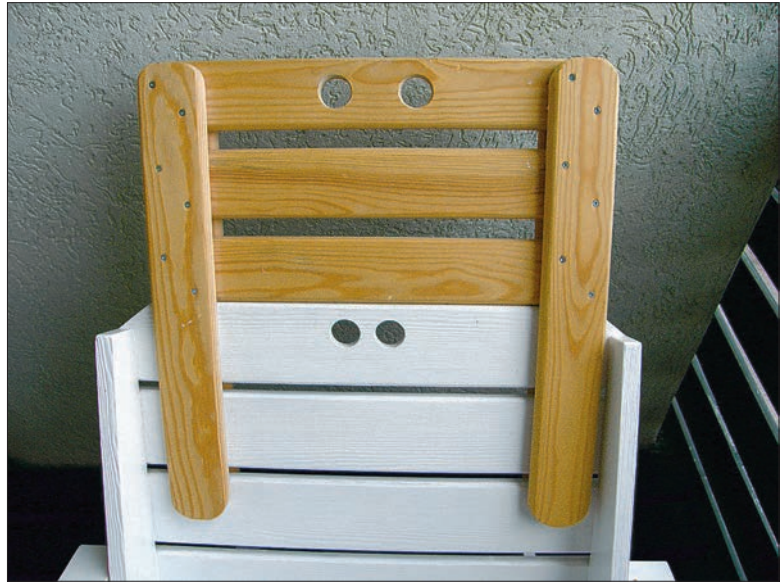
Traditsioonilise aiatooli muudab mugavamaks teisaldatav peatugi.

Peatõe viimistlus tehke sarnaselt aiatooliga, kuid võite selle viimist- leda ka kontrastselt.