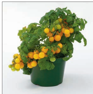
Potis kasvatamiseks on aretatud ka eriti kompaktsed kääbuskasvulisi sorte.

mis aitab taimel liigveega paremini toime tulla.