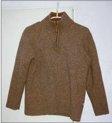
Pruun kampsun, millest kõik alguse sai.