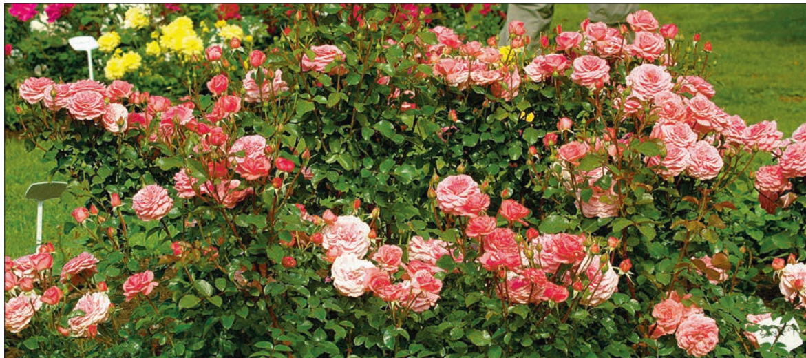
Peenraroos 'Sexy-Rexy' on roosade rooside seas üks rahva lemmikuid, milles oma osa on kindlasti ka roosi nimel.

Väikeaeda sobivad peenraroosid, roniroosid ja pinnakatteroosid.