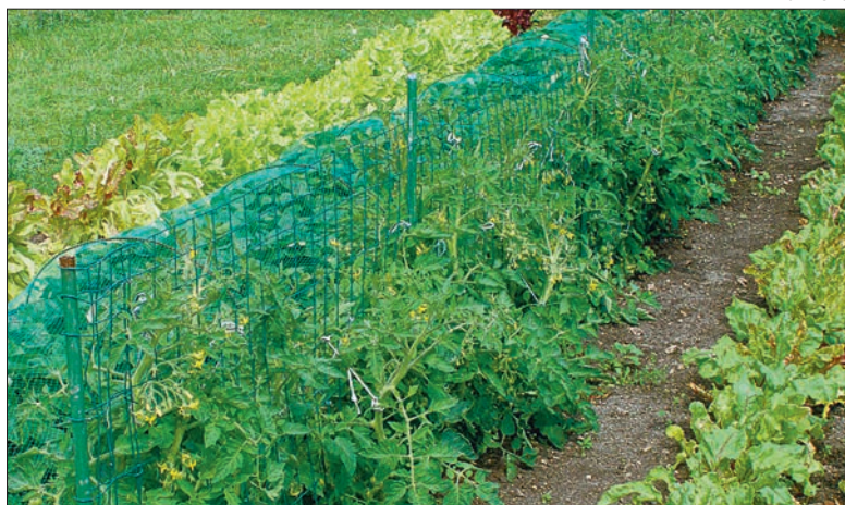
Avamaale valige väga varased ja tomati-pruunmädanikukindlad madalad sordid.

Soojal suvel annavad avamaal kasvavad taimed suurt saaki. Vihmasel ja jahedal suvel jääb saak väiksemaks, sellepärast ongi õuetomati puhul oluline valida võimalikult soe kasvukoht, näiteks maja päikesele avatud lõunakül.