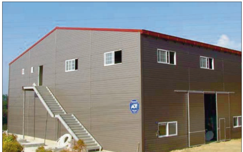
Kõrvalhoonedki võivad olla nägusad, kui need on kenasti viimistletud.

Eesti tootjad pakuvad Printech-tehnoloogia toodete tutvustamiseks hetkel viit tooni, kuid Lõuna-Korea toorainetootja valikus on sadu värve. Nende viie tooni hulgas on näiteks kivimustriga katusekatteks ideaalselt sobiv punakaspruun Teracota, seinaplekikideks sobib hõbedane, kuid äratuntavalt eksklusiiv-