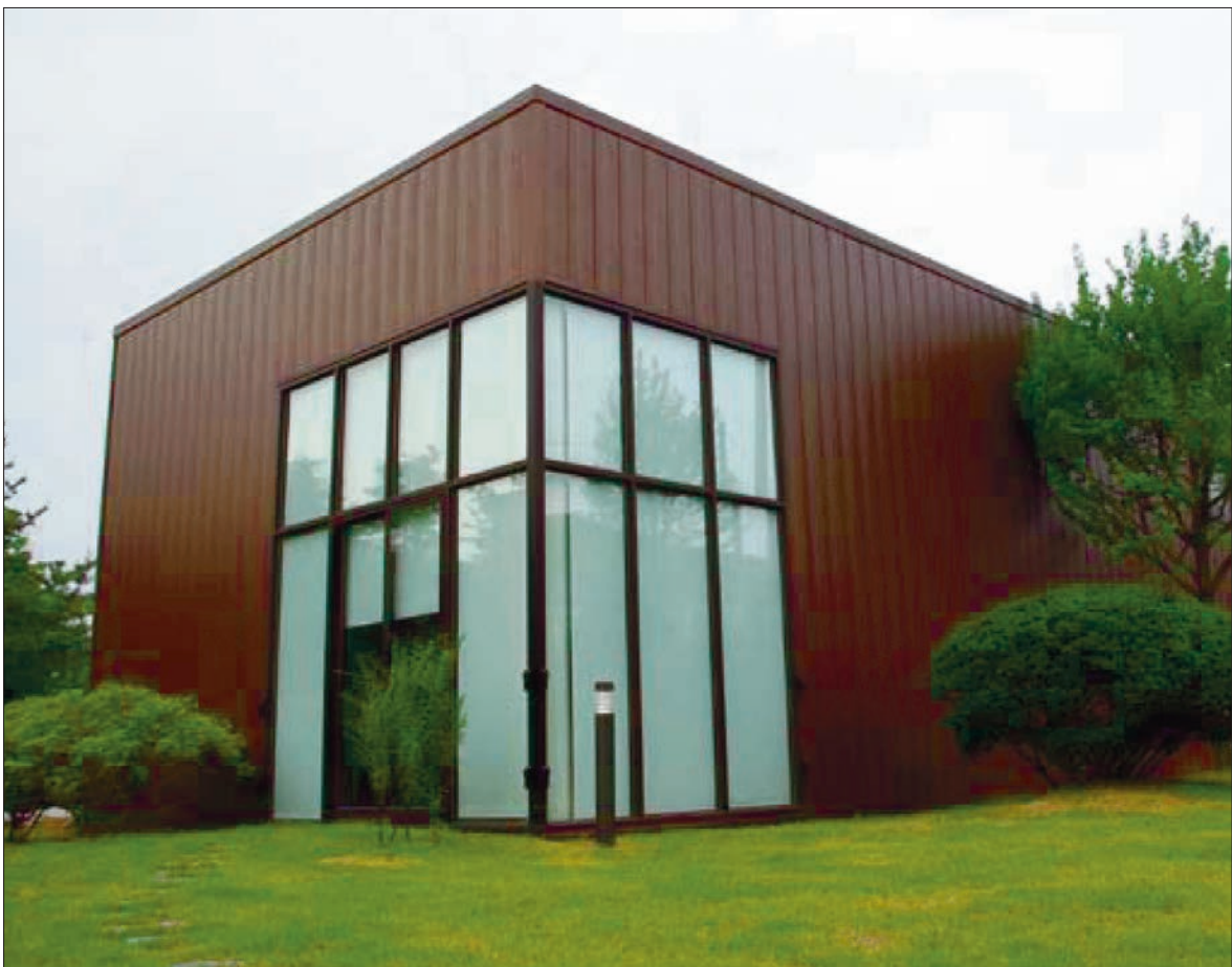
Printech-tehnoloogia annab elamu fassaadiplaatidele puidu välimuse.

Printech-tehnoloogia on kasutusel ka muudes valdkondades, kuid katusekatete jaoks kasutatava on