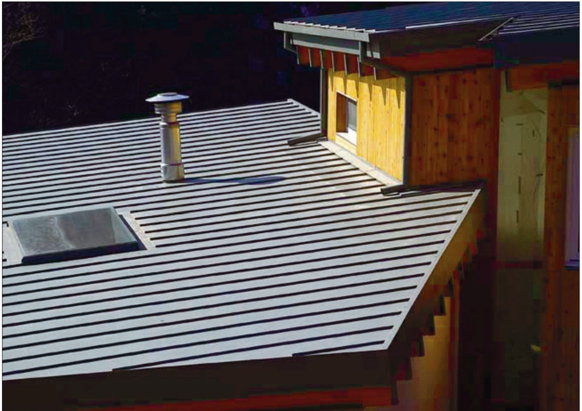
Sellele katusele annab teraspleki ilme samuti uudne tehnoloogia.

Eestisse (aga ka Baltikumi ja Skandinaaviasse) toonud ja toomas innovaatilised Lõuna-Korea ettevõtted. Printechi materjalidest katusekatteid profileerivad Eesti ettevõtted. Seega on Eestis võimalik tellida selle uudse tehnoloogia abil valmistatud kõiki meil tuntud teraskatuste profiile. Selleks võib olla nii kiviprofiil kui ka kõige erinevamad lainelised ja trapetsprofiilid. Samuti võib Printech-tehnoloogia abil viimistletud katteid kasutada sileplekina või painutatuna näiteks interjööris.