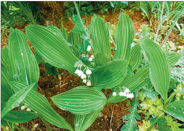
Sordi 'Pawlowsky's Gold' lehti kaunistavad kollased triibud.

panna väetiseks ja multšiks õhuke- se, kas või mõne sentimeetri paksu- se kompostikihi. Nagu juba maini- tud, meeldivad maikellukesele eri- ti tammelehed, ning kui võimalik, võikski nendega multšida. Maikel- kuse juured armastavad jahedat