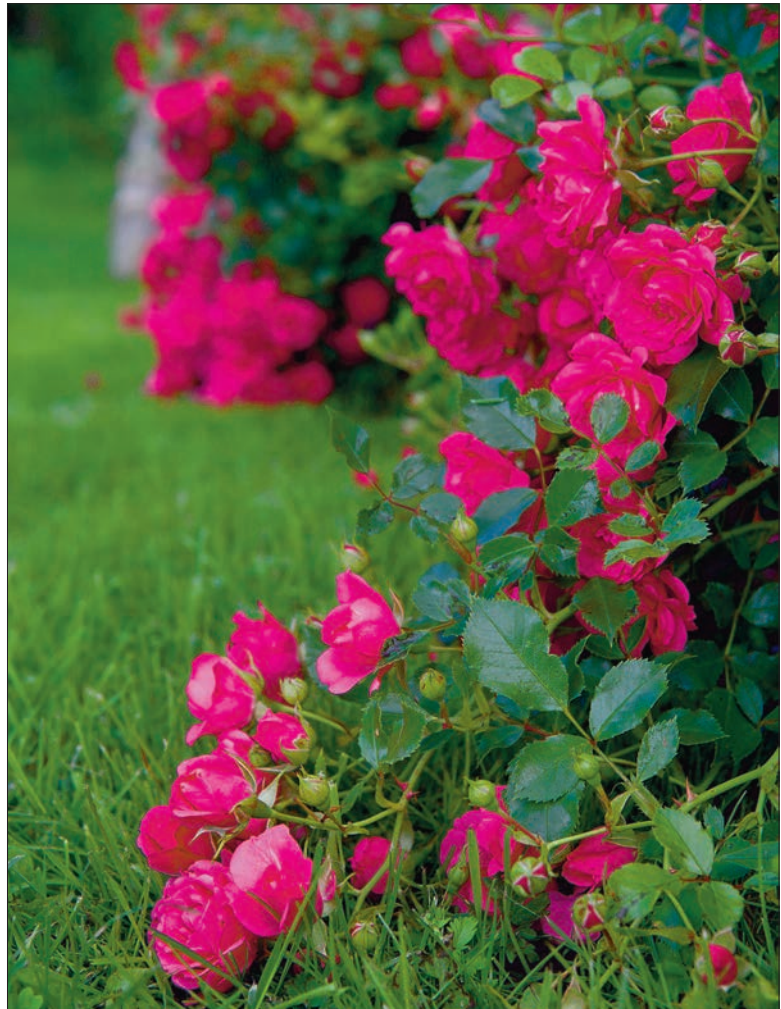
Pinnakatteroos 'Rody' kasvab u 40 cm kõrguseks ja katab meetrise läbimõõduga ringi. Väga haiguskindel. Sobib hästi ka amplicse.

■ Puud ja põõsad. Roosid koos okaspuudega on väga kaunis koos-