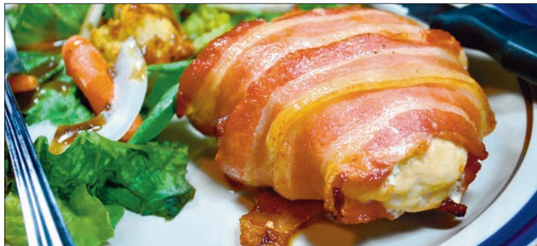
Peekonisse mässitud kanarind kreemjuustu täidisega.

Segage kokku pruun suhkur, kaneel ja pange kõrvale. Vahustage mikseriga või koos valge suhkruga. Segage ükshaaval sisse munad ja lisage vanilliekstrakt. Segage teises kausis kokku küpsetuspulber ning jahu ja valage see võiesusse.