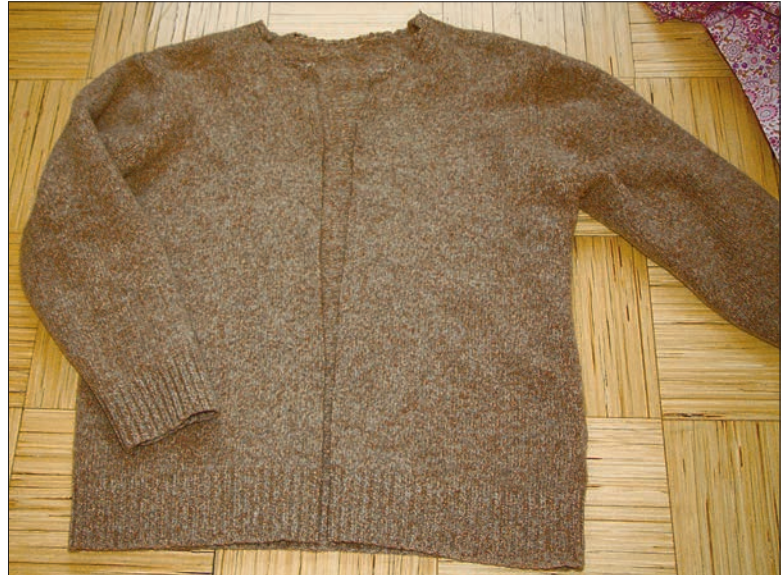
Harutasin lühikese luku ja krae küljest, mõõtsin esiosal keskkoha, ning käärید asusid tegutsema.