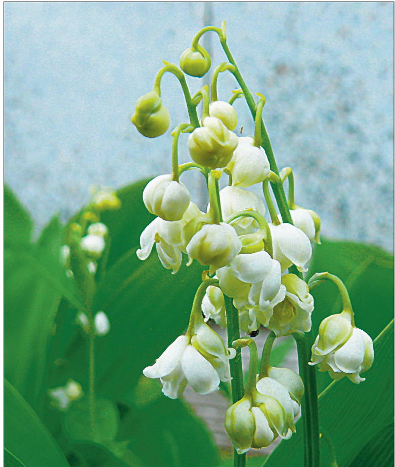
Hariliku maikellukese täidisõieline sort 'Plena'.

Harilik maikelluke on levinud Kesk- ja Lõuna-Euroopast Hiina-