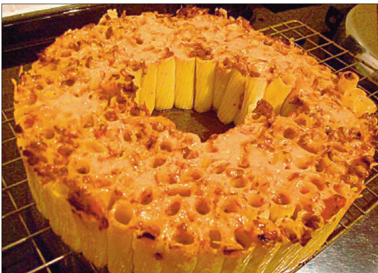
Rigatoni pastast pirukas.

Keetke pastat veidi vähem aega kui pakil kirjas, kurnake ja valage üle 1 sl oliiviõli-ga. Küpsetage liha 5 minutit eraldi nõus