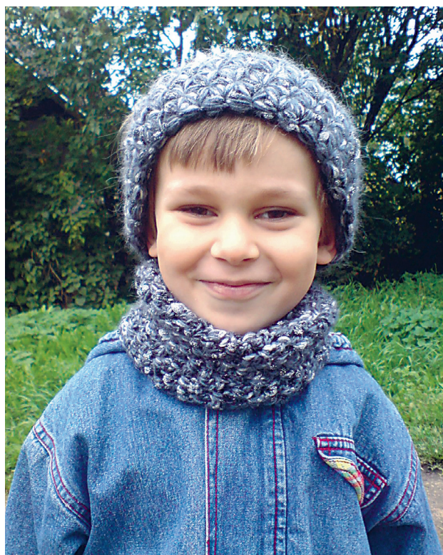
Peapael on mõnus ja praktiline.